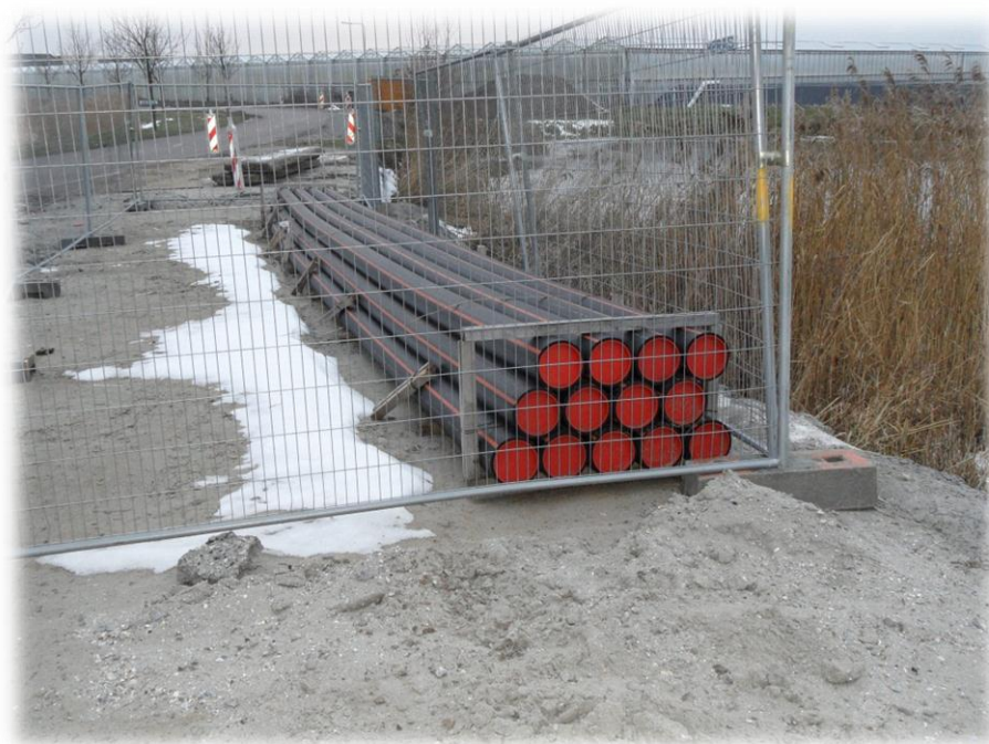
Figuur 5: Persleidingen

Het deel van de rioolpersleiding in de Puijendijk kan worden gehandhaafd. De status van deze dijk (regionale waterkering) zal door de ontwikkeling Waterdunen niet wijzigen.