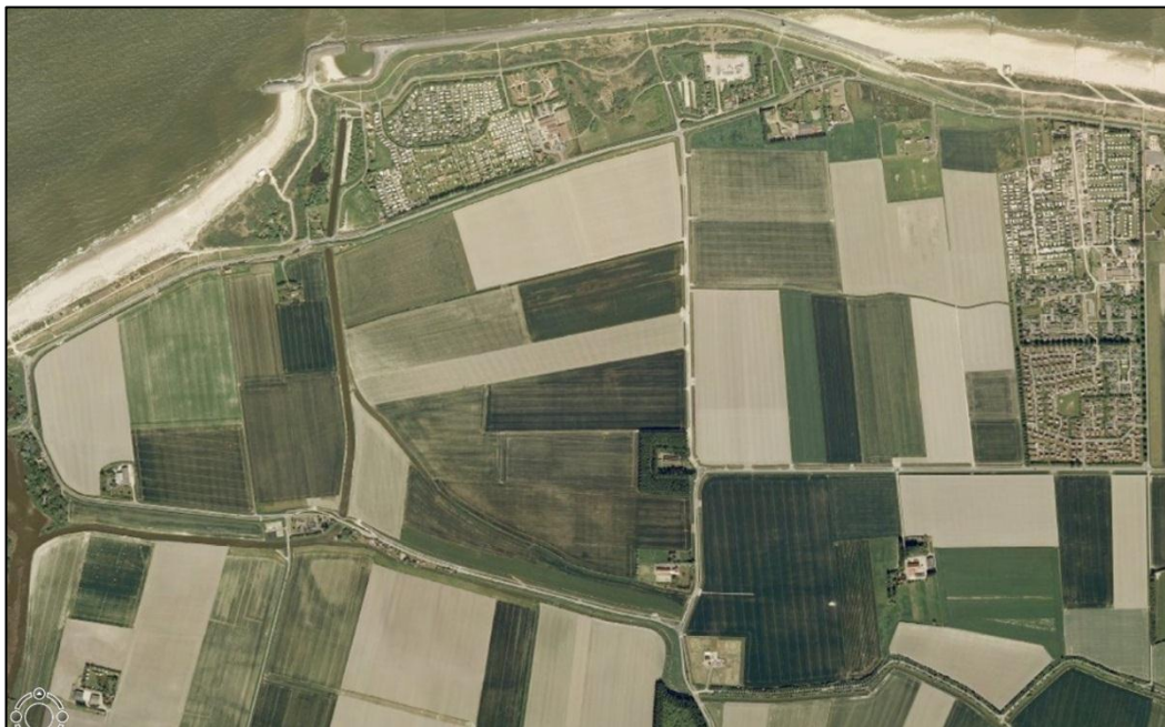
Figuur 1: plangebied Waterdunen

Een belangrijk aandachtspunt is dat de kabels welke gehandhaafd blijven binnen het plangebied te allen tijde aangesloten dienen te zijn op de afvalwaterketen en de nutsvoorzieningen. Dit betekent dat als de nieuwe voorzieningen aangelegd en in gebruik zijn de bestaande structuur verwijderd kan worden.