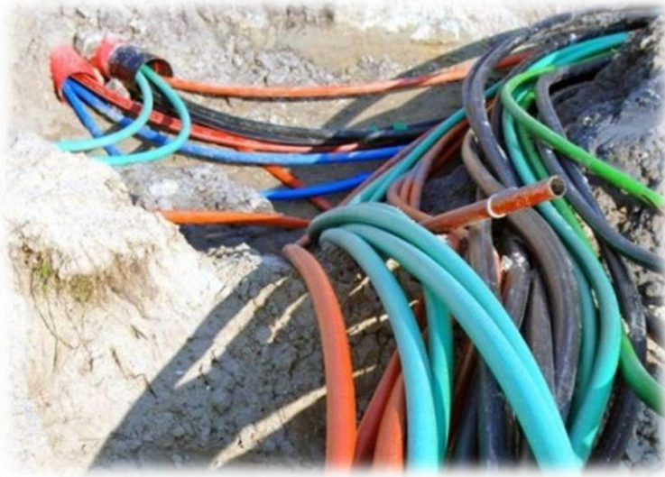
Figuur 4: Kabels en leidingen