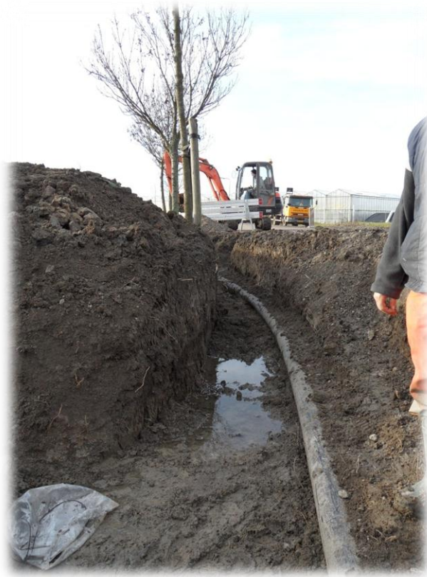
Figuur 6: Aanleg van persleiding