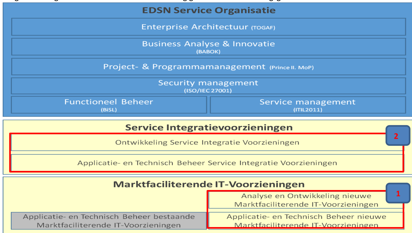
Figuur 1: Scope Aanbesteding EDSN in relatie tot de EDSN Services Organisatie

De gekaderde gebieden in onderstaande afbeelding geven het beschouwingsgebied van hiervan weer: