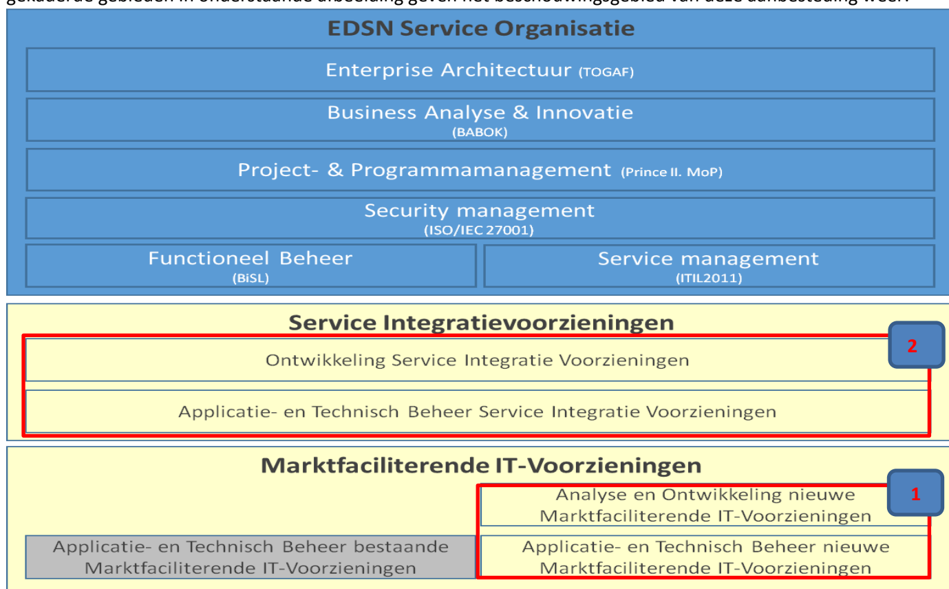
Figuur 1: Scope Aanbesteding EDSN in relatie tot de EDSN Services Organisatie

EDSN heeft een voorkeur voor het realiseren van Service Integratievoorzieningen op basis van Standaardsoftware. In het uitwerken van nieuwe oplossingen zal altijd eerst bekeken worden in welke mate er Standaard oplossingen beschikbaar zijn en of die voldoen. Pas wanneer dit niet mogelijk blijkt wordt Maatwerk software een optie. De gekaderde gebieden in onderstaande afbeelding geven het beschouwingsgebied van deze aanbesteding weer: