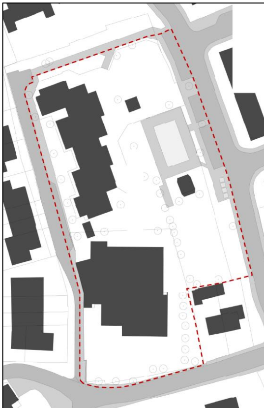
Figuur 1 Huidige locatie

In figuur 2 zijn de contouren van het Definitief Ontwerp van het nieuwe MFC (aangegeven in het rode kader) op de beoogde locatie weergegeven. De huidige horecagelegenheid, het speelveld/voetbalkooi en woningen (aangegeven in het groene kader) blijven gehandhaafd op de bestaande locatie. In het blauwe kader is het perceel aangegeven dat beschikbaar is voor de realisatie van woningen (deze werkzaamheden maken geen onderdeel uit van deze aanbesteding).