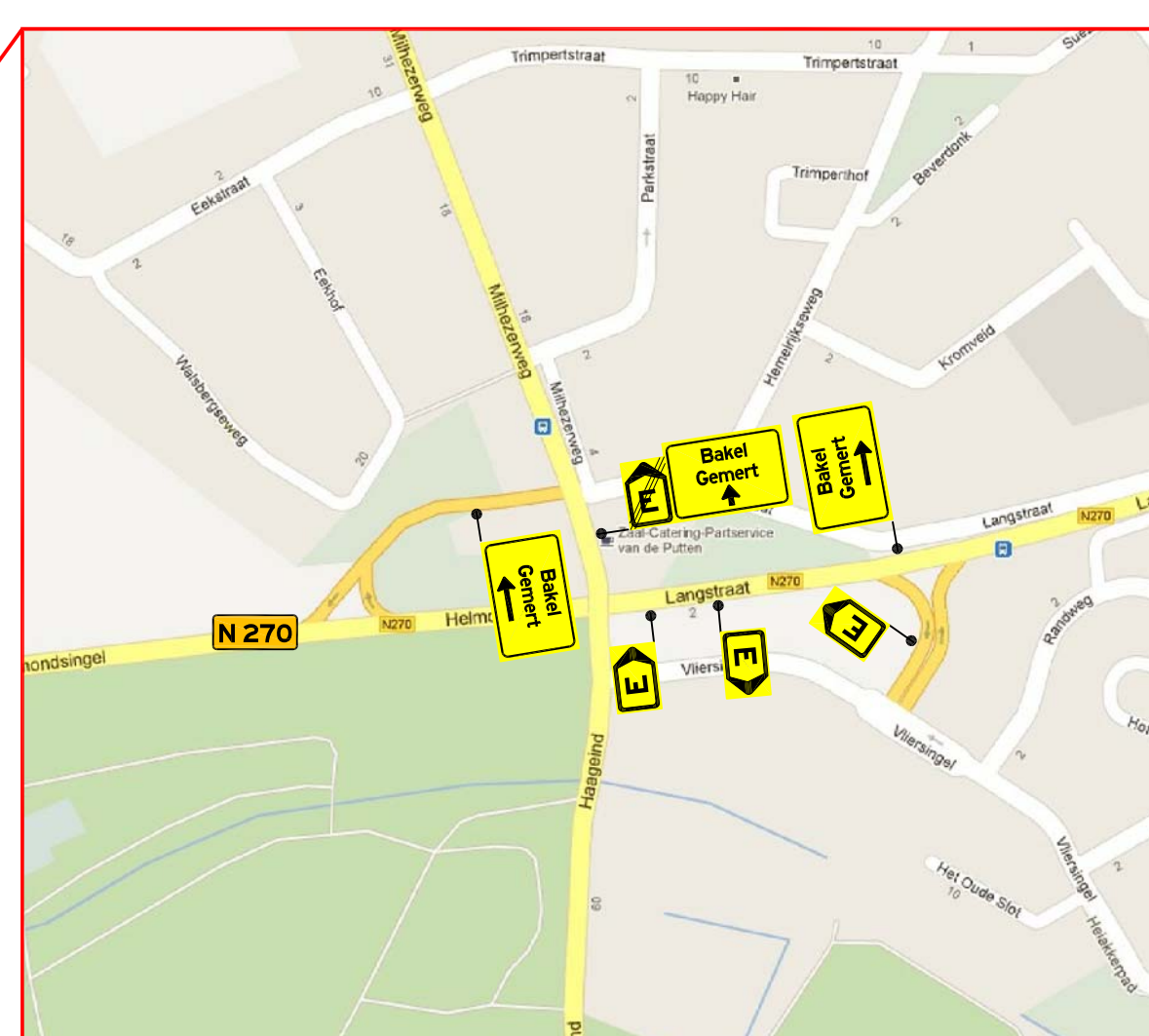
Adviesroute vrachtverkeer thv Helmond