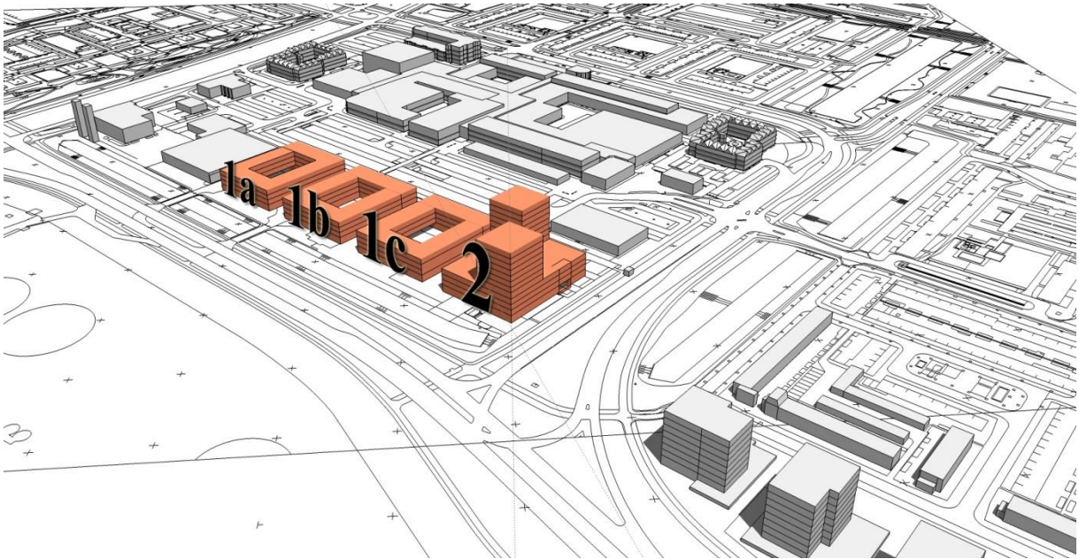
figuur 1 - locatie bouwplot

Voor meer informatie over de achtergrond bij het programma wordt verwezen naar het SPvE.