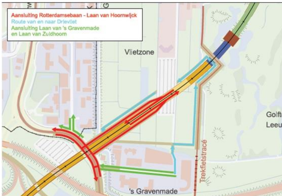
Routes verkeer dat via de aansluiting op de Laan van Hoornwijk rijdt

Omdat er bij de aansluiting van de Laan van Hoornwijk op de Rotterdamsebaan onvoldoende ruimte is voor linksaf-voorsorteervakken van voldoende lengte naar zowel de Rotterdamsebaan als naar de Laan van 's-Gravenmade (denk ook aan touringcars en bezoekerspieken Drievliet) zijn deze bewegingen gecombineerd in één lange linksaffer naar de Laan van 's-Gravenmade. Dit komt ook de verkeersafwikkeling op de kruising als geheel ten goede. Op dit moment wordt onderzocht of het mogelijk is een directe doorsteek te maken voor linksafslaand verkeer naar de Rotterdamsebaan.