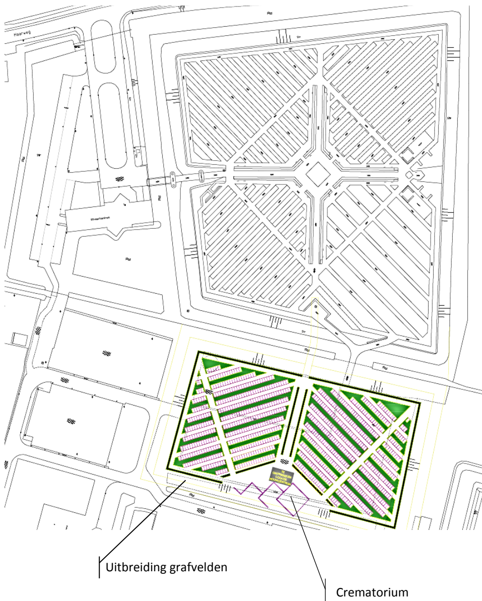
Figuur 1: beoogde realisatie crematorium