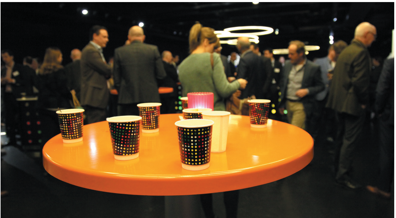
Marktdag 2015.

Johan had ook nog een waarschuwing: 'Als je op TenderNed een opdracht ziet waarvoor je je wilt inschrijven heb je daarnaast een geldige, gekwalificeerde elektronische handtekening (PKI-certificaat) nodig. Die digitale handtekening is juridisch gelijk aan een gewone handtekening en die aanvraag moet dus gebeuren door de juiste tekenbevoegde persoon in het bedrijf. Tekent de verkeerde persoon dan geldt, ook digitaal, dat je inschrijving ongeldig is.' Voor de werking van TenderNed verwees Johan naar het Stappenplan digitaal inschrijven op TenderNed.