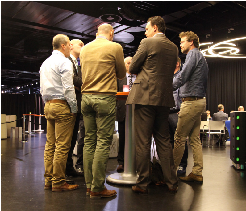
Workshops Marktdag 2015.

In de middag werd in drie gespreksrondes verder gepraat. Wat hier gezegd en gevraagd werd, helpt Rijkswaterstaat bij het inrichten van de uiteindelijke aanbestedingsvragen en -procedures van de investeringsplanning voor de Vlootvervangning. We spraken over gunnen op prijs en kwaliteit, over TenderNed en over het al dan niet al in de aanbestedingsvraag de kosten voor onderhoud van een schip meenemen.