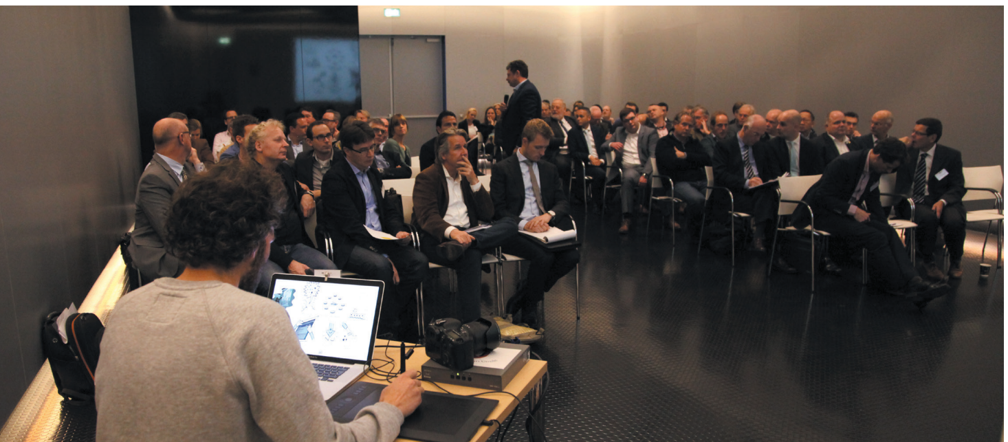
Marktdag 2015.