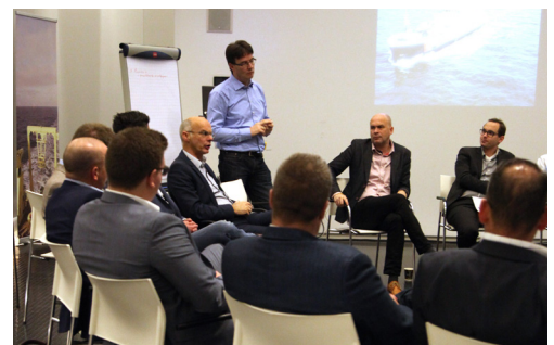
Workshops Marktdag 2015.

Om de vaartuigen en hun bemanningen in de vaart te houden is een breed scala aan artikelen nodig. Dit gesprek ging over de mogelijkheden om de toelevering van scheepsbenodigdheden, voor zowel de zee- als de binnenvaart, efficiënt vorm te geven. Wat is er voor de Rijksrederij belangrijk en wat voor de markt? De markt is nu vooral gericht op business-to-business zakendoen en heeft overheidsaanbestedingen niet in het vizier. Waarom wordt de levering van scheepsbenodigdheden aanbesteed en niet op bonnen ingekocht? Hoe kunnen we elkaar straks vinden in contractstukken? Het gesprek leidde tot meer begrip voor elkaars positie en mogelijkheden.