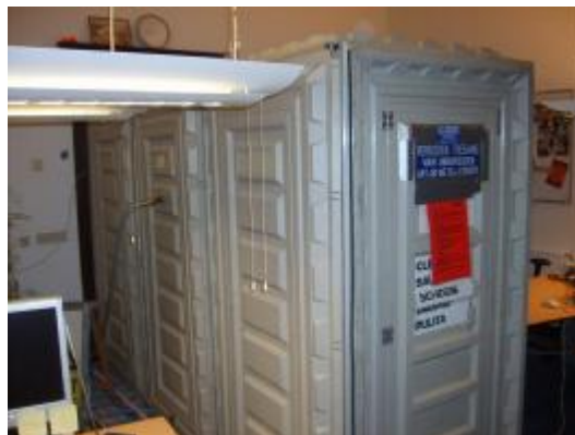
foto 02: opbouw van het containment voor het verwijderen van vloerzeil. De douche is in het kantoor geplaatst