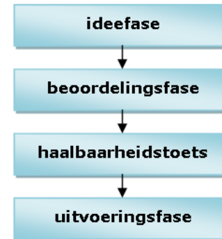
Fasering van de prijsvraag

De prijsvraag is opgedeeld in vier fasen: