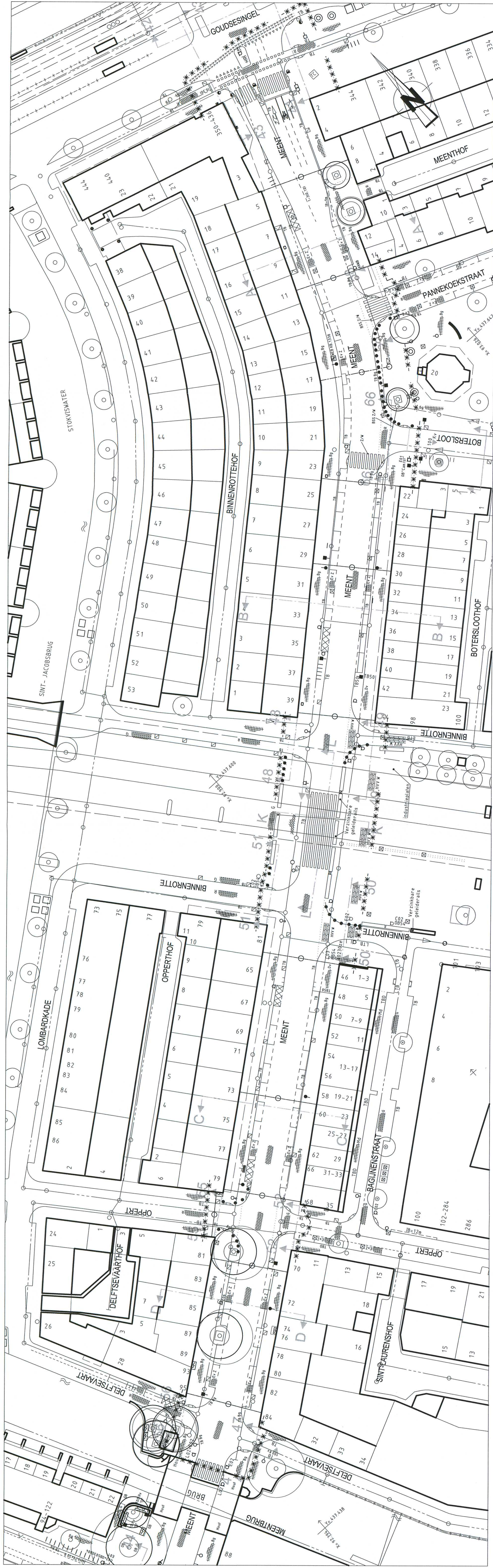
BESTAANDE SITUATIE SCHAAL 1:500

S. Bouhaloul Gedirecteerd: R. van der Pluijm 03-03-2009 Peraat