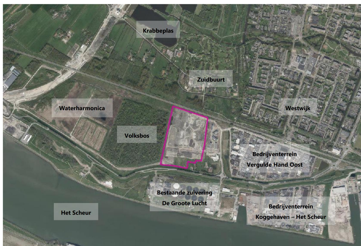
Figuur 1 Locatie nieuwe waterzuivering op Vergulde Hand West ten opzichte van awzi De Groote Lucht en andere locaties

Delfland heeft het betreffende perceel gekocht van de gemeente Vlaardingen. Het perceel wordt uiterlijk 1 september 2027 door de gemeente bouwrijp opgeleverd aan Delfland. Bouwrijp betekent in dit geval vrij van verontreinigingen, met het maaiveld op 0 m NAP. De bestaande wegenstructuur blijft gehandhaafd. Aan het perceel grenzen twee boerderijen en aan de oostzijde bevindt zich, in ieder geval tot 2030, woonwijk Mrija. Het plangebied is hierdoor relatief afgebakend en kent beperkte risico's op het gebied van verontreinigingen en archeologische vondsten.