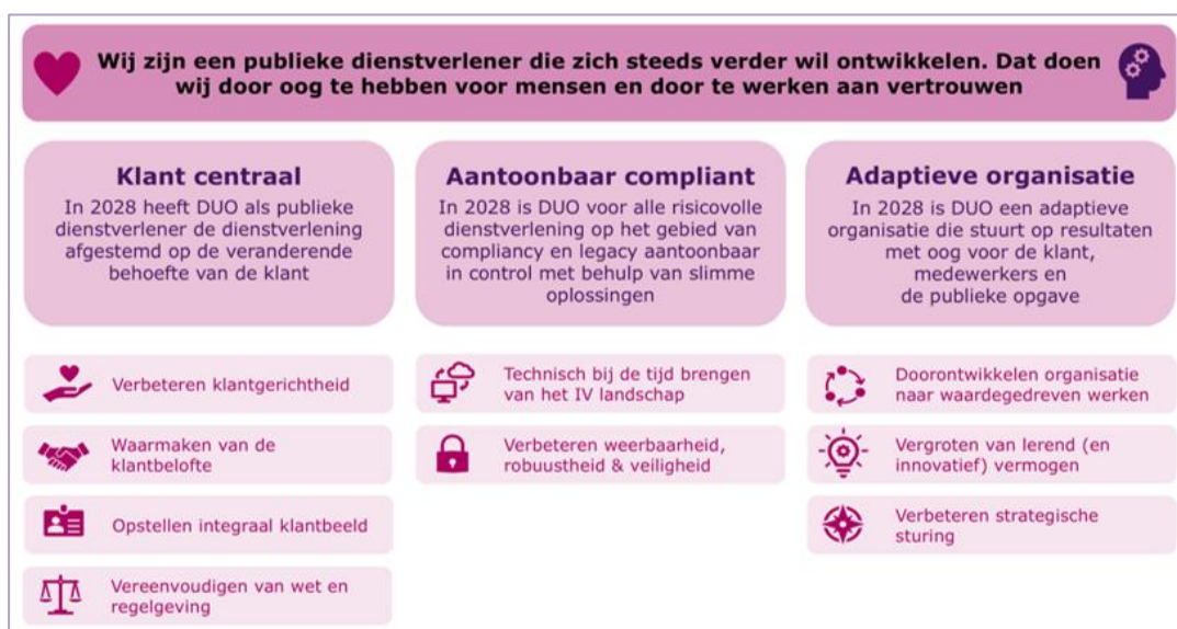
Figuur 1 Strategische thema's DUO