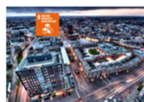
9. INDUSTRIE, INNOVATIE & INFRASTRUCTUUR