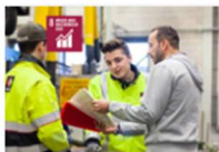
8. EERLIJK WERK & ECONOMISCHE GROEI