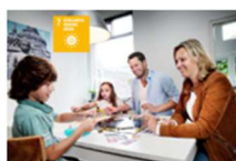
7. BETAALBARE & DUURZAME ENERGIE