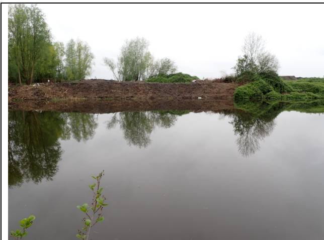
Locatie: Aanzicht westzijde