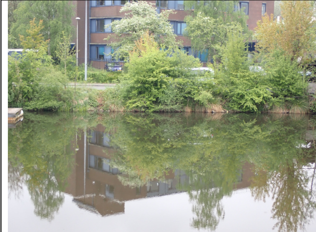
Locatie: Aanzicht oostzijde