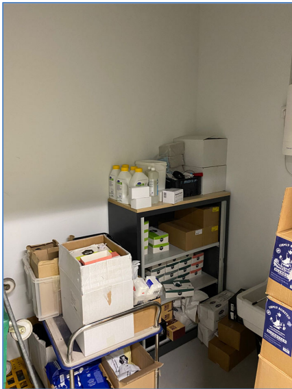
Figuur 5: Onderzoeksbouw