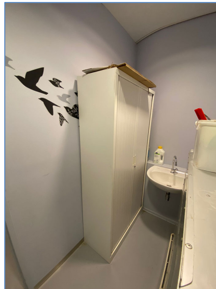
Figuur 2: Gebouw OZW