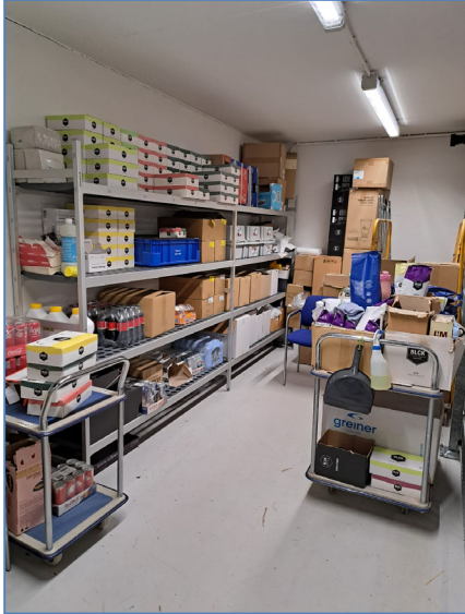
Figuur 3: Gebouw O|2