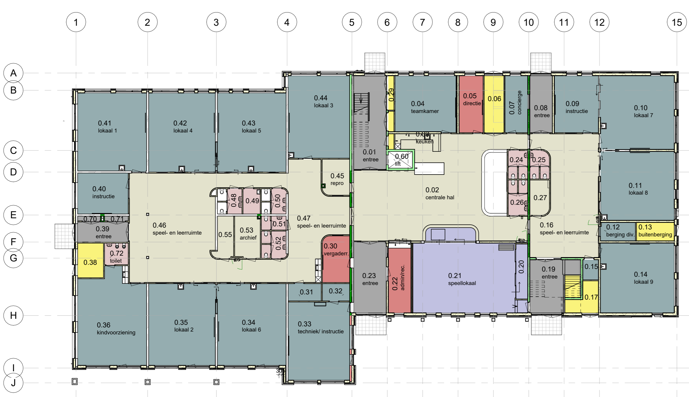
Begane grond peil=0