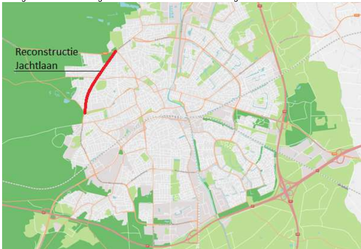
Figuur 1 - Kaart plangebied Reconstructie Jachtlaan

De Jachtlaan ligt aan de westkant van Apeldoorn en is onderdeel van stadsdeel Noordwest. Het plangebied bevindt zich tussen de kruising Zwolseweg - Loolaan - Amersfoortseweg (N344) aan de noordzijde en de rotonde John F. Kennedylaan - Laan van Spitsbergen - J.C. Wilsaan aan de zuidzijde. Ten westen van de Jachtlaan ligt de wijk Berg en Bos en ten oosten de wijk Sprengenbos. De weg vervult een essentiële rol in de bereikbaarheid van de stad en is daarmee van strategisch belang voor zowel het doorgaande verkeer als de lokale ontsluiting.