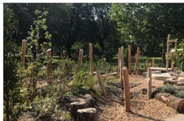
Voorbeeld 'inrichting natuurlijk spelen'