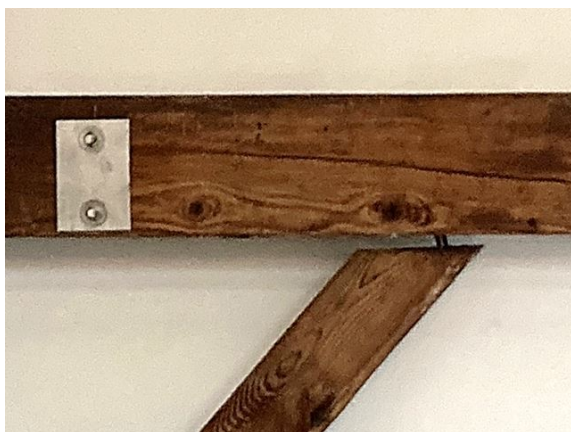
dak no. 23: schoor gedeeltelijk losgekomen (2024)