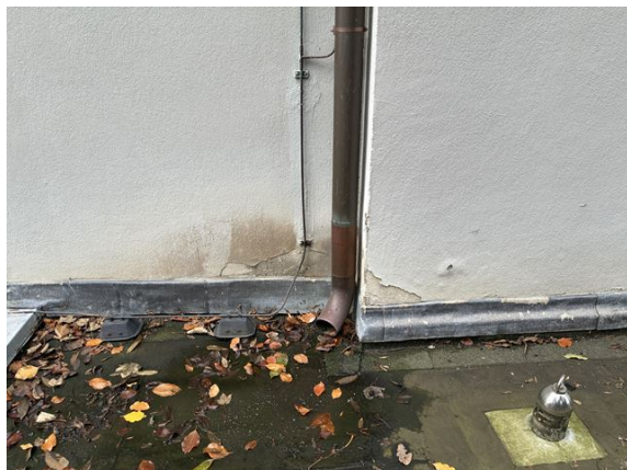
gevel no. 7: buitenpleisterwerk beschadigd (2025)