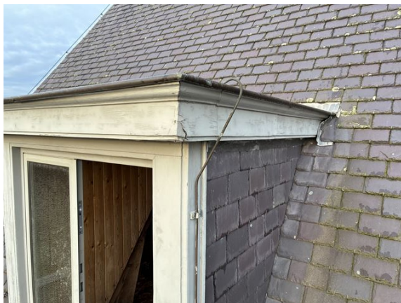
dakkapel no. 27: losgekomen vulmiddel (2025)