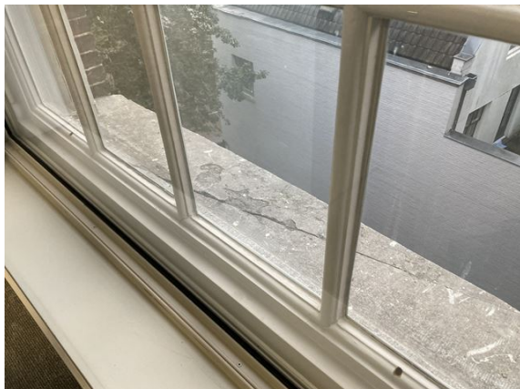
gevel no. 29: raamlekdorpel gescheurd (2024)