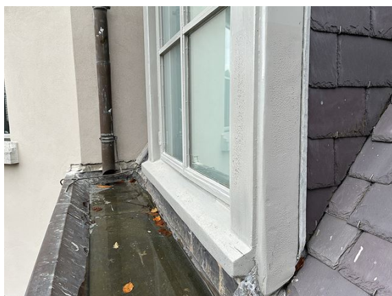
dakkapel no. 34: verf beschadigd door regen (2025)