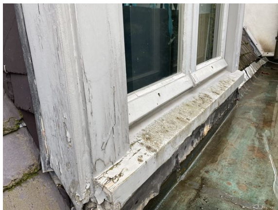
dakkapel no. 28: houtwerk flink verweerd / droogscheuren (2024)