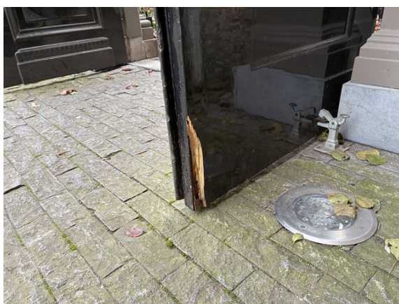
tuinmuur no. 32: poort beschadigd (2025)