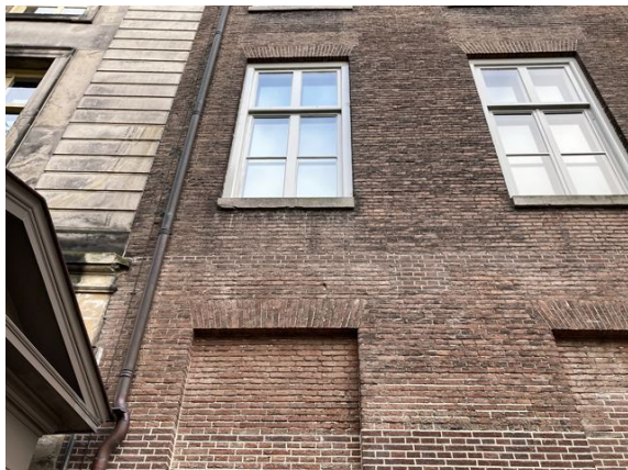
gevel no. 29: voegwerk weggefallen (2024)