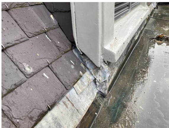
dakkapel no. 33: lood sluit niet goed aan bij buitenkozijn (2024)