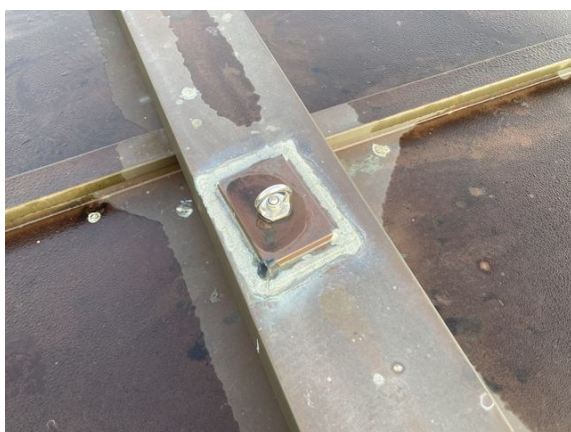
dak no. 1: openstaande naad koperbedekking, tijdens inspectie 2023 tijdelijk afgedicht met kit (2024)