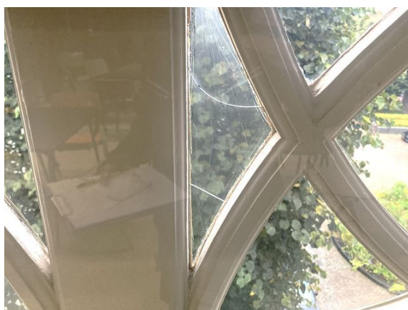
gevel no. 1: ruitje gescheurd (2024)