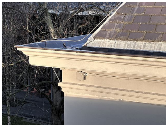
gevel no. 15: verf gootlijst vervaald en gebarsten (2025)