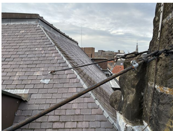
gevel no. 2: schoren van beelden roestig (2024)