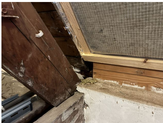
dak no. 11: muurplaat naast dakkapel ingerot (2025)