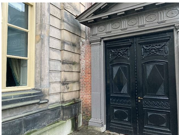
gevel no. 32: regenwater komt op het natuursteen (2023)