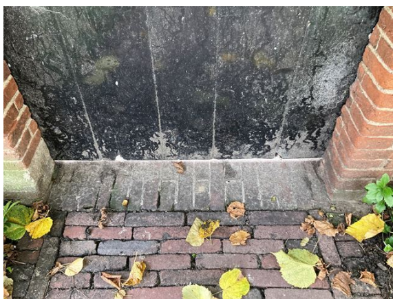
gevel no. 33: poort onderaan ingerot (2024)