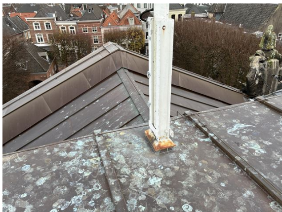
dak no. 1: voet vlaggenmast roestig (2025)