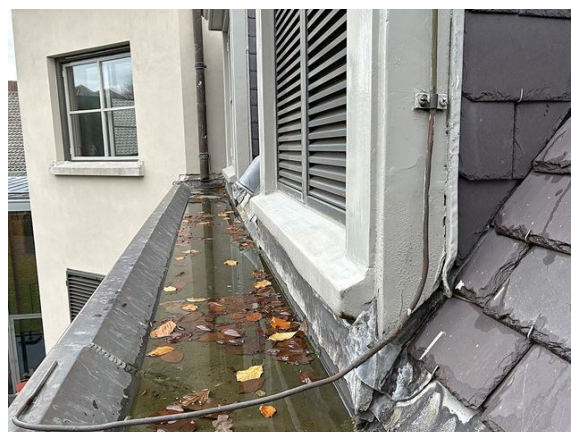
dakkapel no. 33: verf door regen beschadigd (2025)