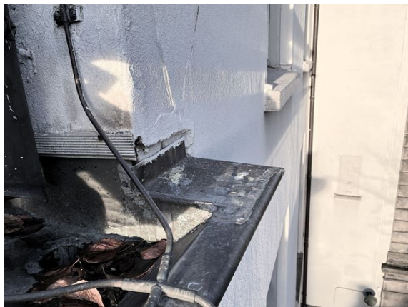
gevel no. 8: gevellood ontbreekt boven goot no. 11 (2025)