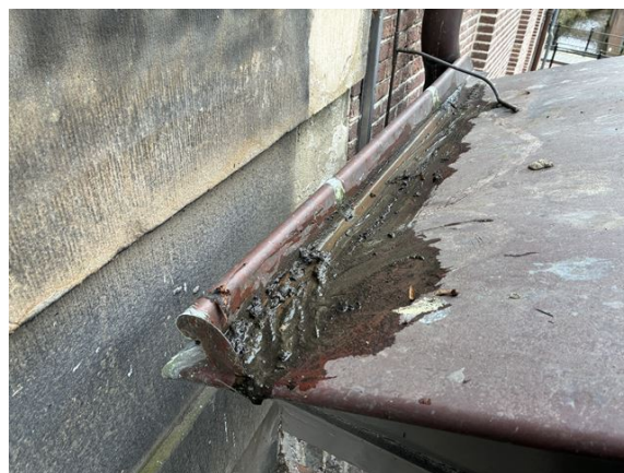
dak no. 36: regenwater stroomt over het kopschotje aan de verkeerde kant naar beneden (2025)