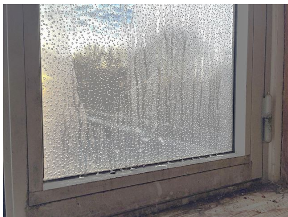
dakkapel no. 27: blazen in beglazing (2025)