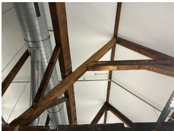
zolder: oude aantasting houtborende insecten (2025)