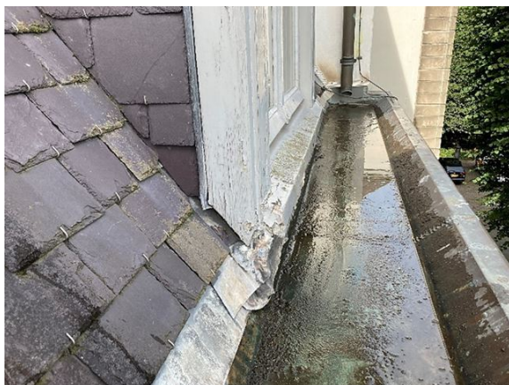
dakkapel no. 28: geen overlapping met indekloket (2023)