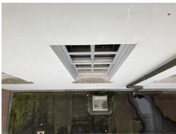
gevel no. 14: verf vervaald en gebarsten (2024)