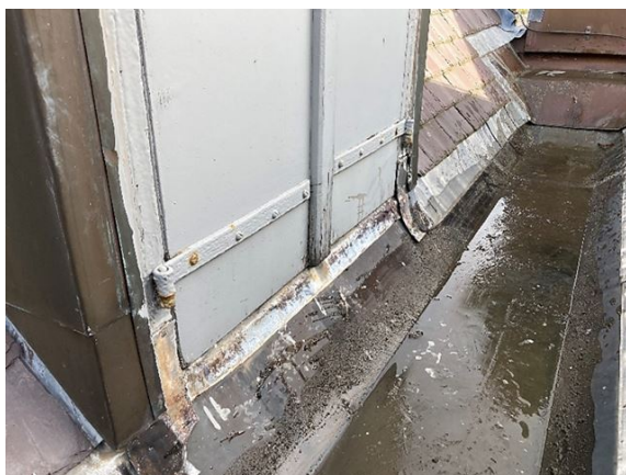
dakkapel no. 35: lood losgekomen van kozijnstijl (2023)