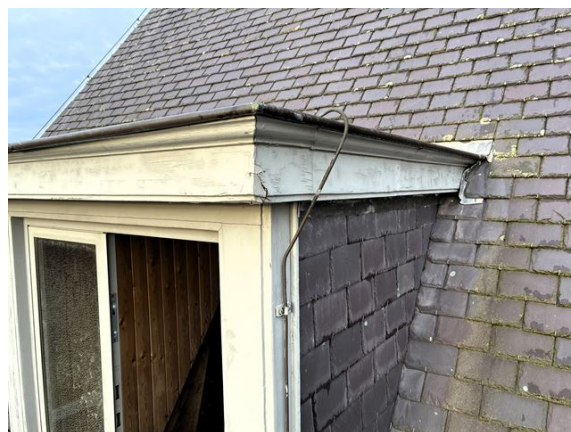
dakkapel no. 27: buitenschilderwerk gebarsten (2025)