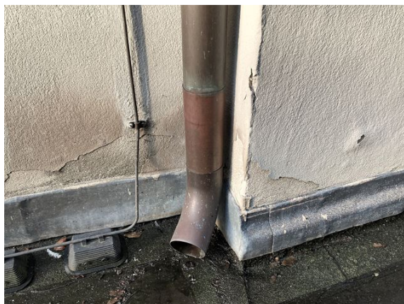
gevel no. 7-14: verf vervuild en beschadigd (2024)