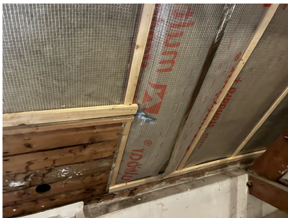
dak no. 10 t/m 15: tape komt plaatselijk los (2025)