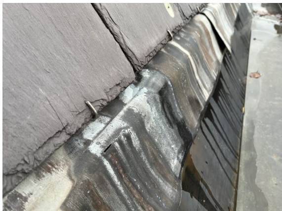
goot no. 3: voetlood onder dak no. 8 doorgesleten (2025)