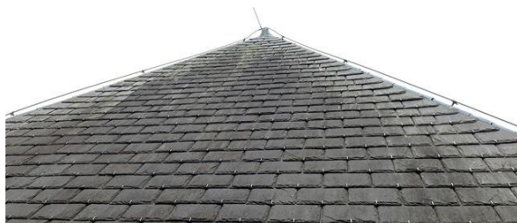
dak no. 10: bliksemafleider verbogen (2024)