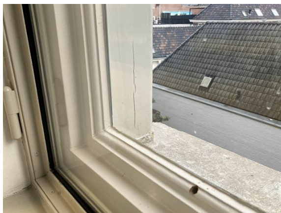
gevel no. 29: droogscheur (2024)

– Verspreid komen droogscheuren in het kozijnhout voor.