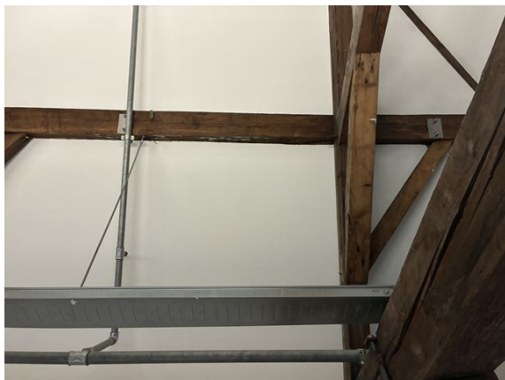
zolder: schoor ontbreekt onder dak no. 8 (2025)