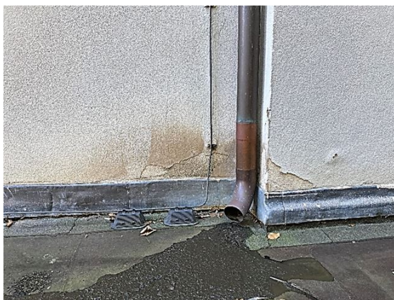
gevel no. 7-8: bevestigingsbeugel ontbreekt (2023)