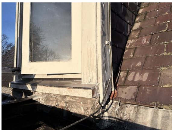
dakkapel no. 30: verf gebarsten, verf gootlijst ontbreekt plaatselijk (2025)