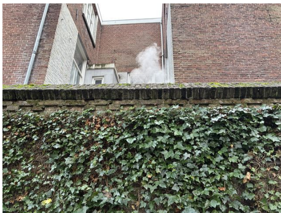
tuinmuur no. 33: voegwerk ontbreekt plaatselijk onder ezelsrug (2025)