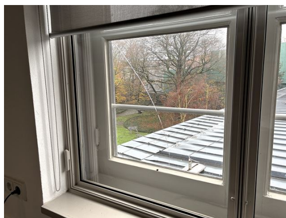
gevel no. 5: ruit gescheurd (2025)