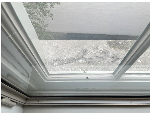
gevel no. 29: ventilatieopeningen van binnenuit geboord (2025)