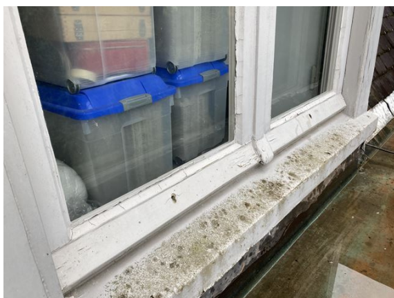
dakkapel no. 29: stopverf gescheurd (2024)