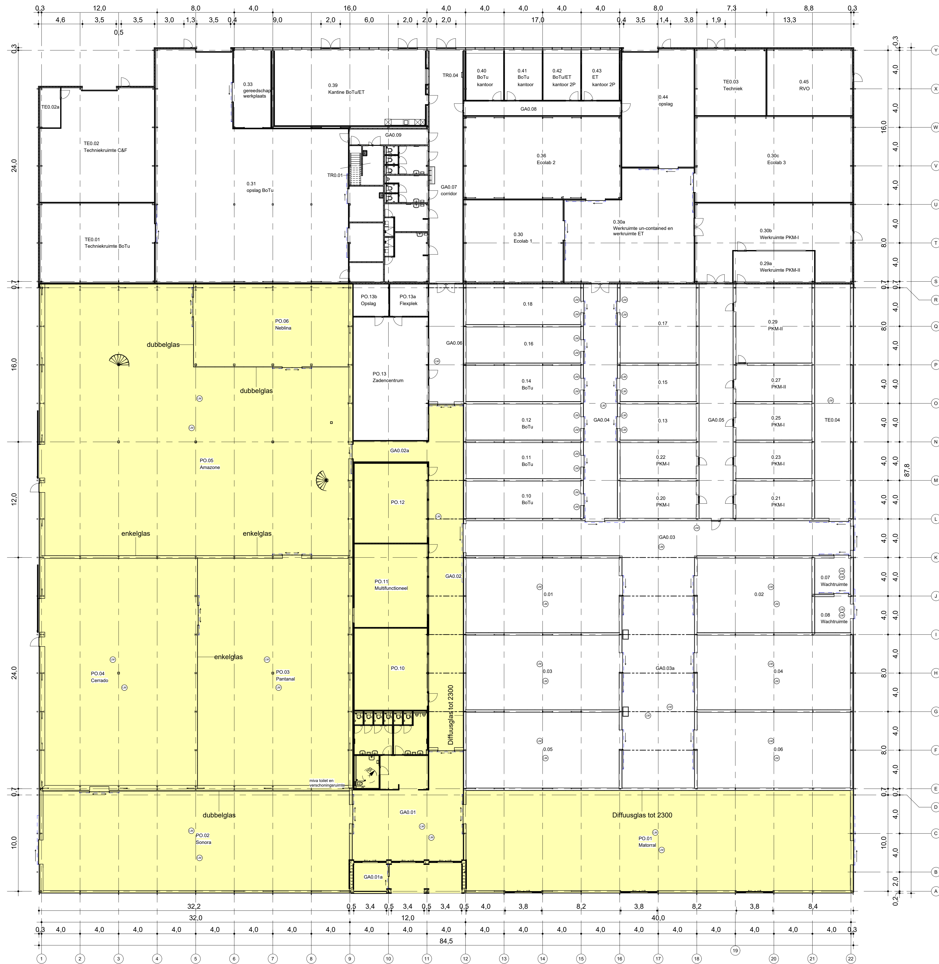
Begane grond 1 : 200