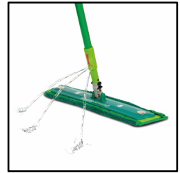
Sprekner systeem van Greenspeed

Dit systeem bestaat uit een aluminium steel met een geïntegreerd waterreservoir. Met een simpele druk op het handvat wordt een gedoseerde hoeveelheid water over het oppervlak gesproeid. De waterdruk in de steel garandeert drie krachtige stralen aan de onderkant van het systeem, zelfs als het reservoir al meer dan 70% leeg is. In het reservoir past bijna een halve liter water waarmee ca. 60-90 vierkante meter kan worden gereinigd.