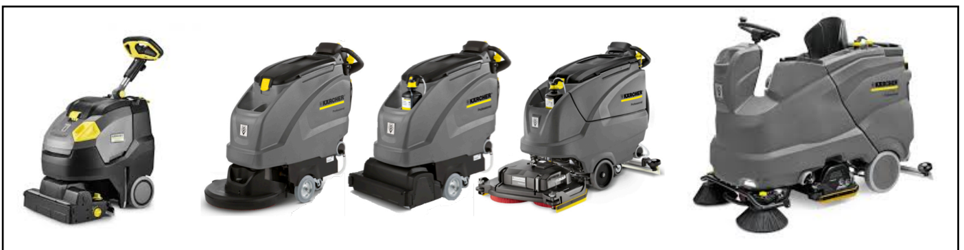
Enkele voorbeelden van schrob-/zuigmachines.

Schrob-zuigmachines zijn goed te gebruiken voor het dagelijkse onderhoud van een vloer. Gebruik van deze machines is veel minder arbeidsintensief en zal veel minder tijd in beslag nemen. De uit te oefenen druk van de borstel of pad op de vloer is vaak ook nog te beïnvloeden.