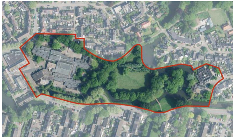
Luchtfoto masterplan Nieuw Zwaluwenburg