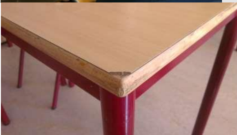
Foto: Voorbeeld schade blad. Onvoldoende gehard / stootvast