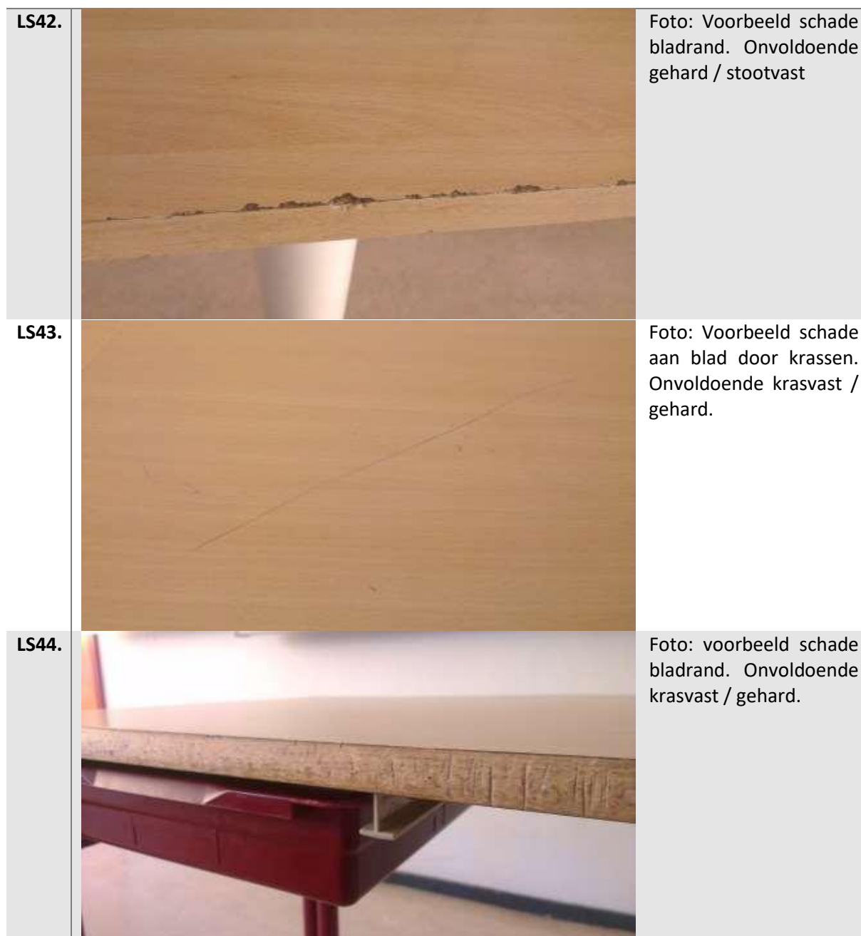
Tabel 22: Overige eisen