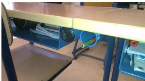
Foto: Voorbeeld van afdichting. Onvoldoende hermetisch afgesloten; mogelijkheid om dop te verwijderen.