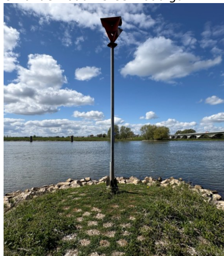
Figuur 1: Huidige situatie

Binnen het huidige areaal bestaat een grote variatie in uitvoering, materiaalgebruik en opbouw. Met het vervangingsplan voor kribbakens wordt toegewerkt naar een meer uniforme uitvoering. In de huidige situatie bestaat het overgrote deel uit stalen masten (zie figuur 1). In de gewenste situatie wordt voornamelijk overgegaan op kunststof masten, die standaard worden uitgevoerd in een lengte van zes (6) meter (zie figuur 2). Op specifieke locaties, zoals bij een aantal verlaagde kribben op de Boven-Rijn, de Waal en de Nieuwe Waterweg, blijven stalen masten in gebruik in lengtes van zes (6) en negen (9) meter. Door deze combinatie van masttypen wordt de uitwisselbaarheid vergroot en worden beheer en onderhoud vereenvoudigd.