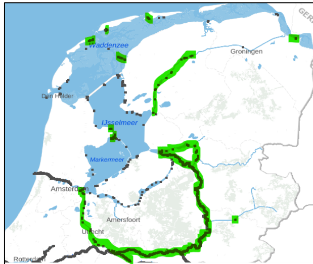
Figuur 3: Perceel 1 - Noord