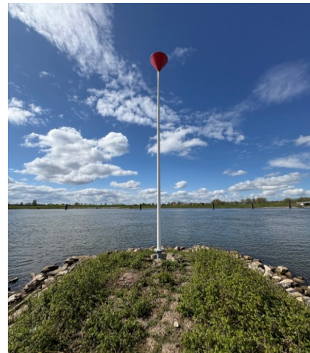
Figuur 2: Gewenste situatie