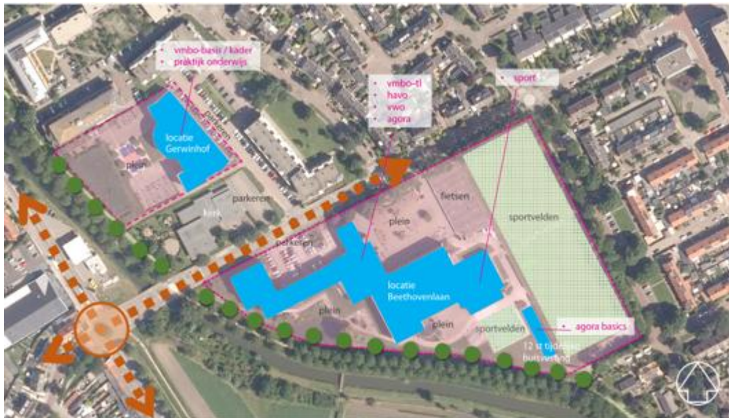
Figuur 1 - Huidige bebouwing

Het Koningin Wilhelmina Collega (hierna hét KWC of KWC) is een VO-school in Culemborg en bestaat uit twee locaties: de hoofdlocatie aan de Beethovenlaan en de nabijgelegen locatie aan de Gerswinhof, zie ook figuur 1.