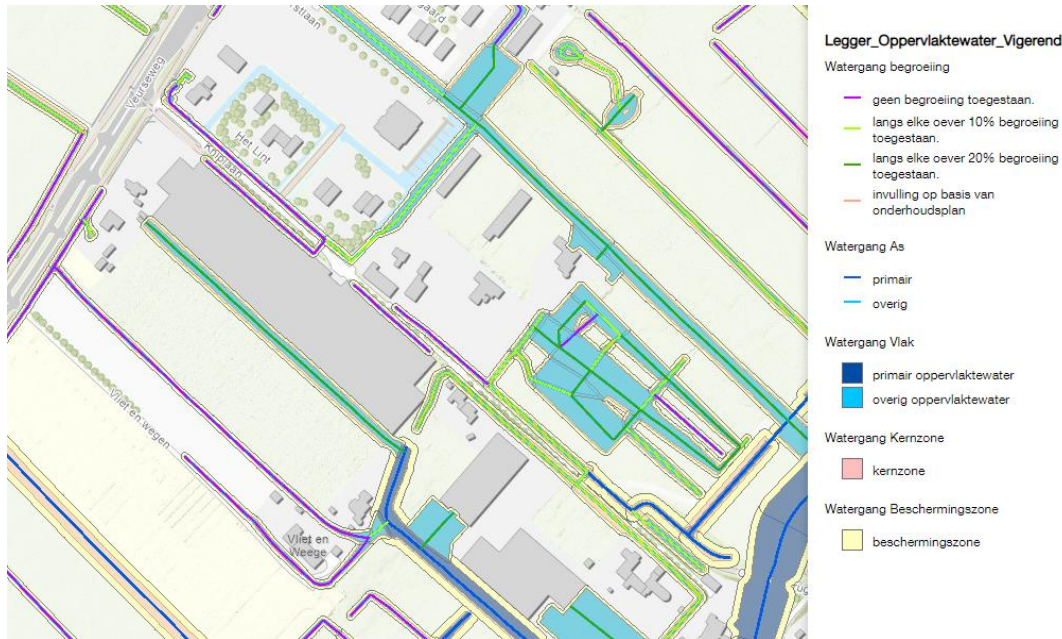
Figuur 2 Vigerende Legger Hoogheemraadschap van Rijnland. Raadpleeg www.rijnland.net voor meer informatie.

Het projectgebied bevindt zich in de zone van de regionale waterkering. Hierdoor wordt de aanleg van de bruggen of damwanden met een duiker gezien als 'bouwen in een kering' en is de aanleg hiervan vergunningsplichtig waarvoor de waterschapsverordeningen geldend zijn. Indien de benodigde brughoofden zo worden aangelegd dat een deel van het oppervlaktewater wordt gedempt, dient dit verlies van oppervlaktewater binnen hetzelfde peilvak te worden gecompenseerd. Dit is ook terug te vinden in bijlage 10.