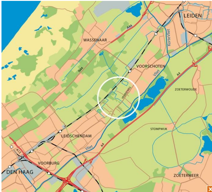
Figuur 1: Ligging Duivenvoordecorridor

Landgoederen en buitenplaatsen verschaffen dit gebied allure. Oorspronkelijk maakte dit gebied deel uit van een veel grotere zone van landgoederen en buitenplaatsen. Kenmerkend was de afwisseling van deze voorname huizen met hun tuinen, parken, bossen en lanen en het open weidelandschap met daarin boerderijen en bebouwingslinten. Deze ruimtelijke spreiding heeft geleid tot een hoge variatie aan open en meer besloten landschapseenheden afgewisseld met grote, beeldbepalende groencomplexen (landgoed Duivenvoorde). De corridor kan derhalve worden getypeerd als een waardevol cultuurlandschap.