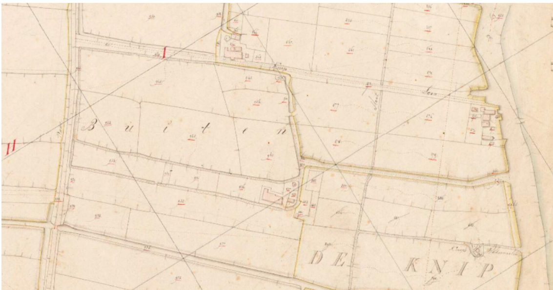
Figuur 3: Historische kaart 'Noortveer'