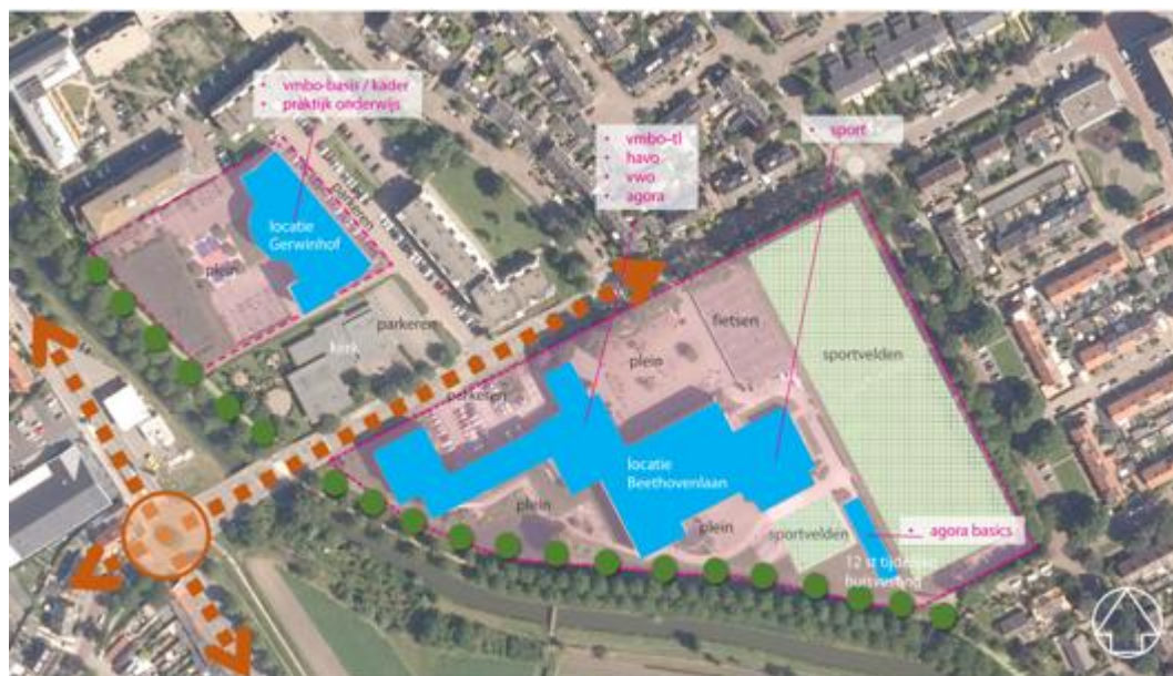
Figuur 1 - Huidige bebouwing

Het Koningin Wilhelmina Collega (hierna hét KWC of KWC) is een VO-school in Culemborg en bestaat uit twee locaties: de hoofdlocatie aan de Beethovenlaan en de nabijgelegen locatie aan de Gerswinhof, zie ook figuur 1.