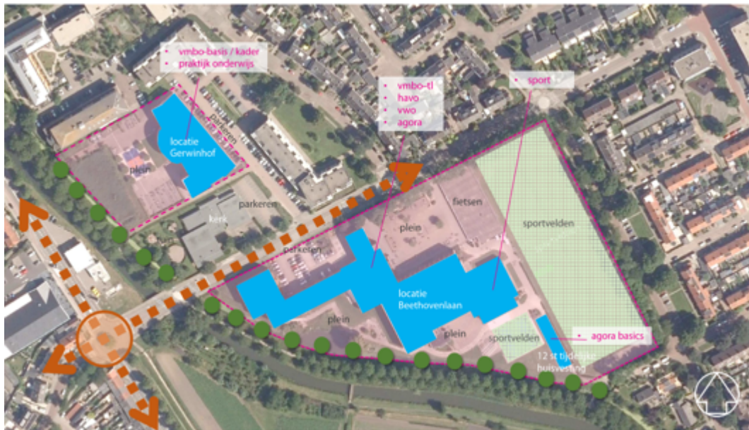
Figuur 1 - Huidige bebouwing

Het Koningin Wilhelmina College (hierna hét KWC of KWC) is een VO-school in Culemborg en bestaat uit twee locaties: de hoofdlocatie aan de Beethovenlaan en de nabijgelegen locatie aan de Gerswinhof, zie ook figuur 1.