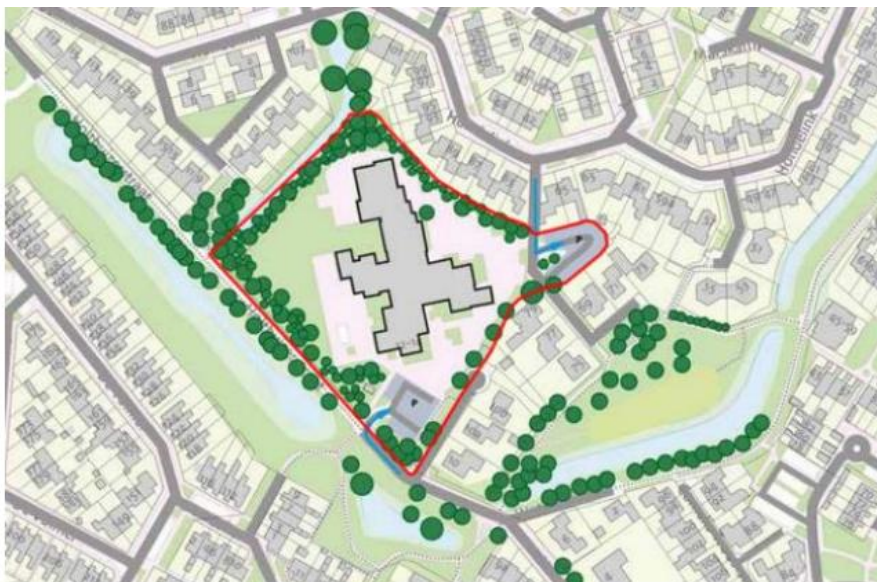
Figuur 1: Projectgebied Holthuizen

Voor de locatie Holthuizen zijn diverse documenten vastgesteld: