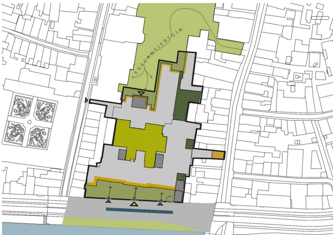
Plankaart van de Egelantier

Voor de Egelantiertuin wordt een ontwerp-suggestie verwacht in samenhang met het interne programma, zodat gebouw en openbare ruimte optimaal op elkaar aansluiten en als cultureel ankerpunt in de stad gaan functioneren. Onderstaand zijn de projectgrenzen van deze opdracht weergegeven en de inpassing daarvan in de omgeving.