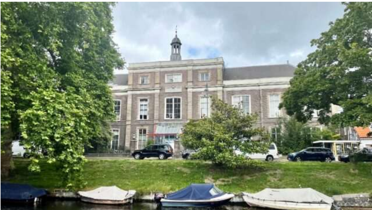
Voorgevel van de Egelantier

We zoeken een excellent integraal ontwerpteam, bestaande uit een ruimtelijk- en een technisch ontwerpteam, dat, in harmonieuze afstemming met de opdrachtgever en eindgebruikers, deze transformatie met visie en vakmanschap vorm kan geven en een uitmuntend publieksgebouw en omgeving kan ontwerpen dat kan dienen als nieuwe vestigingslocatie voor het Frans Hals Museum. Er wordt binnen deze selectie nadrukkelijk gekozen op ontwerp kwaliteit en teamsamenstelling.