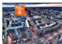
9. INDUSTRIE, INNOVATIE & INFRASTRUCTUUR