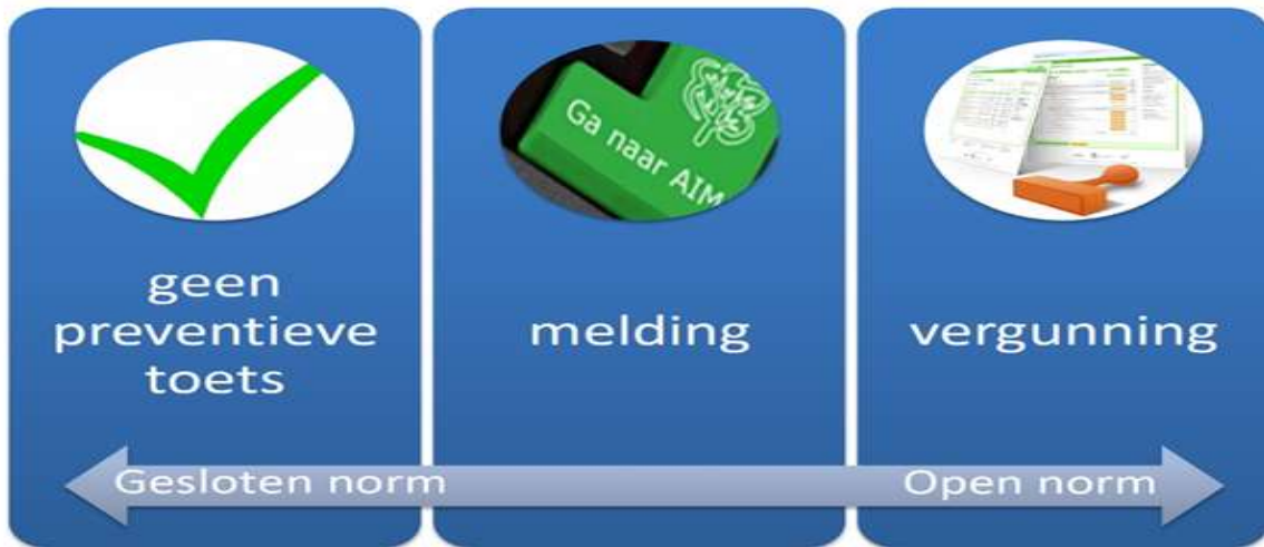
Figuur 4 4: gesloten en open normen versus algemene regels (geen preventieve toets nodig) en vergunningplicht

Zoals uit paragraaf 4.6 blijkt, kiest de gemeente ervoor alleen met algemene regels te werken als deze een gesloten norm bevatten. Algemene regels met open normen geven in de basis 2 onvoldoende rechtszekerheid, duidelijkheid en inzicht of een activiteit wel of niet in overeenstemming is met de regel. Bovendien zijn open normen niet passend in de gedachten van de gemeente over de dienstverlening, waarbij als uitgangspunt geldt dat de gemeente een initiatiefnemer snel duidelijkheid wil bieden of een activiteit wel of niet in de regels van het omgevingsplan past.