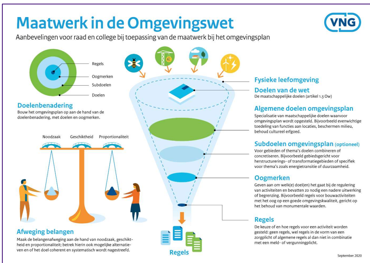
Figuur 3 3: Maatwerk in de Omgevingswet

Deze gelaagde opbouw maakt het mogelijk om van strategisch tot operationeel richting te geven aan de fysieke leefomgeving (zie ook Figuur 3: Maatwerk in de Omgevingswet ).