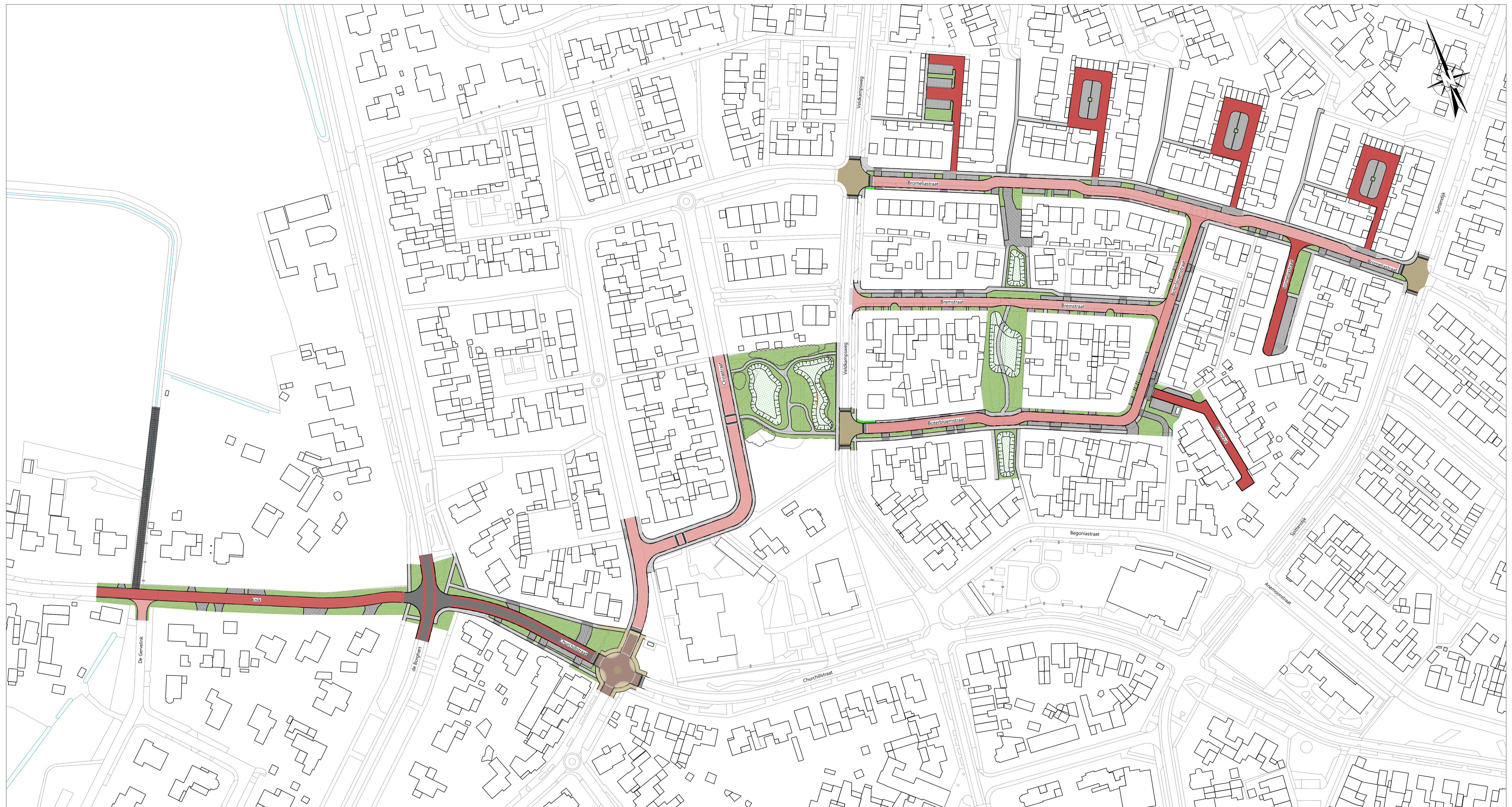
OVERZICHT BOVENGRONDS Schaal 1:1000

Opmerking: * Maaftvoering in meters * Materiaalmaten in millimeters, tenzij anders aangegeven * Hoogtmaten in meters t.o.v. N.A.P.