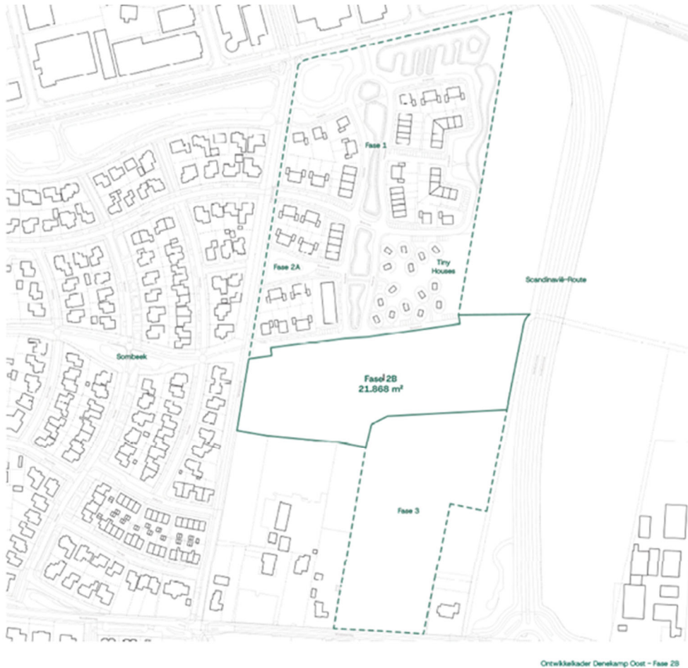
Figuur 1: Kaart fasering (bijlage 10)