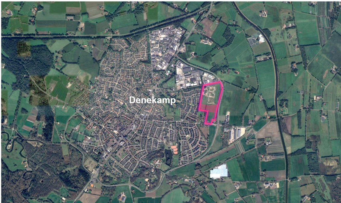
Figuur 2: Locatieaanduiding Denekamp Oost