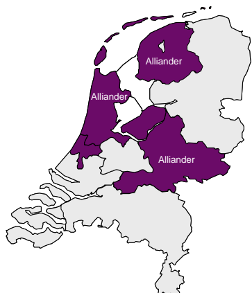
Figuur 2: Het geografische netwerkgebied van Alliander

Het bedrijf is voortgekomen uit de splitsing van Nuon in een productie- en leveringsbedrijf (onder de naam Nuon) en een netwerkbedrijf (onder de voormalige naam Continuon en nu onder de naam Liander). Het netwerk van Alliander bevindt zich voornamelijk in de provincies Noord-Holland, Gelderland, Friesland en Flevoland (zie figuur 2).