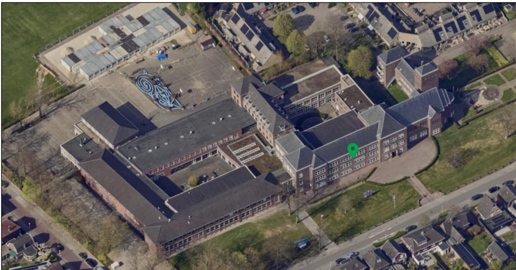
Figuur 1 Luchtfoto van het Twents Carmel College, locatie Lyceumstraat.

De opgave betreft vernieuwbouw voor het huidige gebouw van onderwijslocatie Lyceumstraat in Oldenzaal. De Lyceumstraat is onderdeel van brede scholengemeenschap Twents Carmel College die voor heel Noordoost-Twente voortgezet onderwijs verzorgt verspreid over zes locaties. De Lyceumstraat biedt onderwijs aan op havo, vwo (inclusief gymnasium) en vwo-extra niveau voor leerlingen vanaf leerjaar 3.