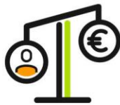
Beheer & exploitatie