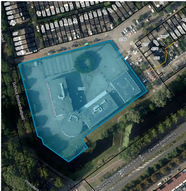
Afbeelding 1: totaal bovenaanzicht Revius incl. terrein

VSO op Noord verhuist naar het schoolgebouw van Revius, waarbij beide scholen gebruik gaan maken van het schoolgebouw van Revius. Dit schoolgebouw ligt aan de president Rooseveltlaan 11 in Rotterdam. Het gebouw heeft geen monumentale status.