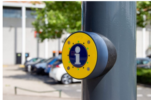
Afbeelding 3.1: Voorbeelden knop auditieve ondersteuning Haltesysteem type A, D en E.