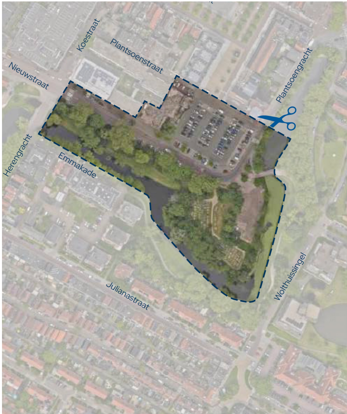
Afbeelding 1: luchtfoto Projectgebied