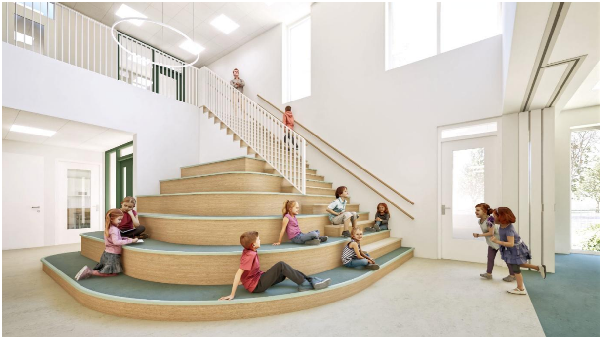
Afbeelding 5: centrale hart