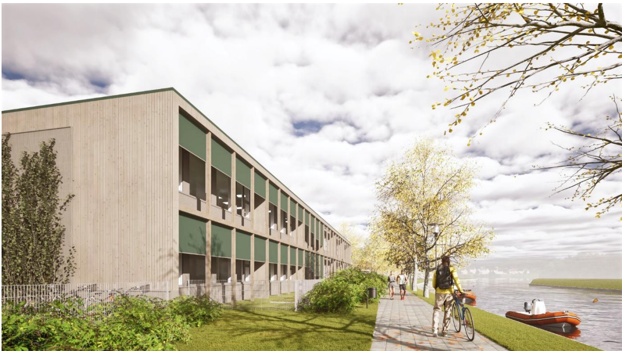
Afbeelding 4: ooghoogte vanaf Jaagpad langs Heemsteeds Kanaal