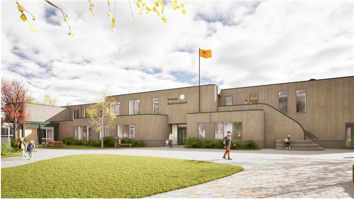
Afbeelding 3: ooghoogte vanaf Von Brücken Focklaan