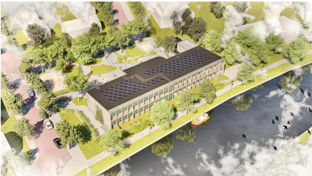
Afbeelding 2: vogelvlucht vanuit zuid