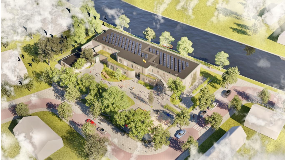
Afbeelding 1: vogelvlucht vanuit west