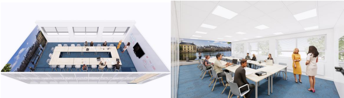
Figuur 2: Impressie van een vergaderruimte 10 of meer personen

Daarnaast onderscheidt UWV de volgende specifieke (vergader)ruimtes: