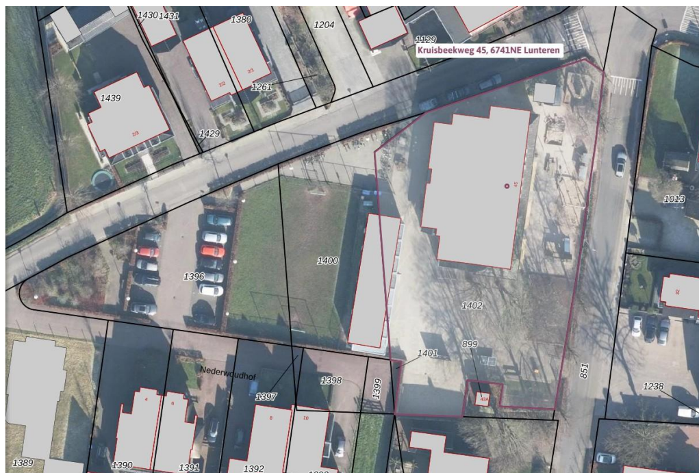
Figuur 2 Kadastrale grenzen locatie

Alle drie de kavels zijn in eigendom van SmdB. Nadere toelichting per kavel: