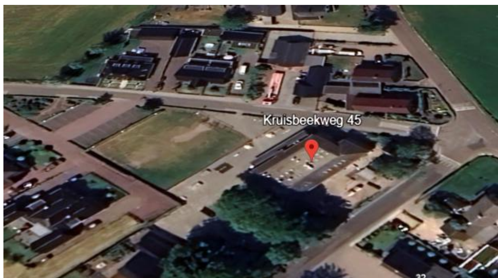
Figuur 1 huidige situatie geprojecteerd op luchtfoto

De huidige locatie Nederwoud is de oudste en kleinste school met een hoofdgebouw dat (deels) stamt uit 1905. De ouderdom van het gebouw, maar ook de constante groei van het aantal leerlingen zorgt dat het gebouw haar (maximum) capaciteit heeft bereikt. In het Integraal Huisvestingsplan (IHP) van de gemeente Ede is daarom opgenomen dat Basisschool Nederwoud in 2028 in aanmerking komt voor vervangende nieuwbouw.