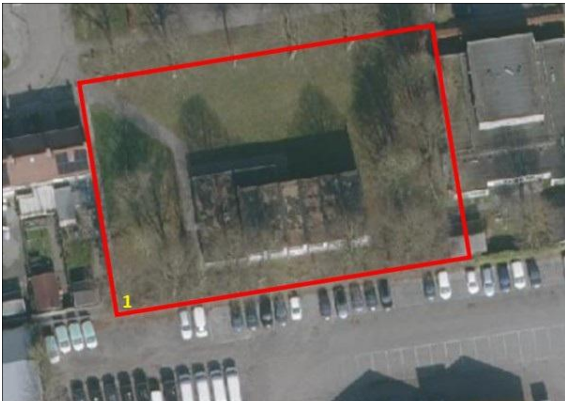
Figuur 5: locatie De Swetten, De Brekken, Drachten, rood omkaderd. 1= boom met holte. Achtergrond: regels op de kaart

Op de locatie staat bebouwing (een gymzaal), deze wordt gesloopt (figuur 5). De gemeente wil op de locatie 6 woningen bouwen. De bomen op de locatie blijven voor zover bekend behouden.