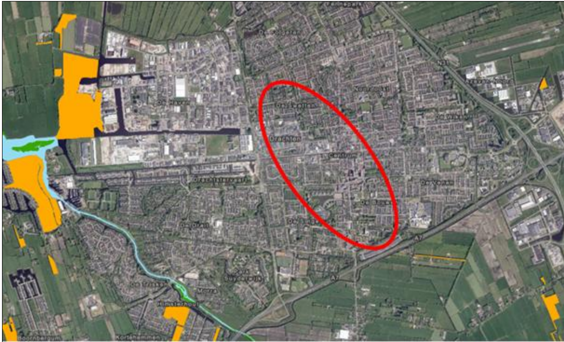
Figuur 3. Locaties (rode ovaal, globale weergave) ten opzichte van natuur buiten NNN (oranje) en het NNN (blauw en groen).