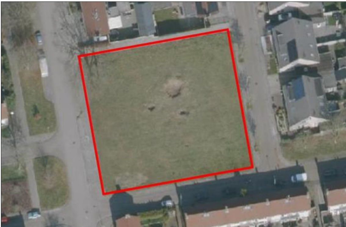
Figuur 4: locatie De Swetten, De Geeuw 31, Drachten, rood omkaderd.

Het betreft een onbebouwd grasveld met enkele bomen. De gemeente wil op de locatie 10 woningen bouwen (figuur 4). De bomen worden gekapt.