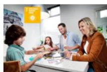
7. BETAALBARE & DUURZAME ENERGIE