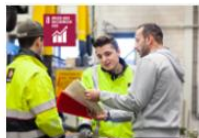
8. EERLIJK WERK & ECONOMISCHE GROEI