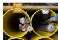
12. VERANTWOORDE PRODUCTIE & CONSUMPTIE