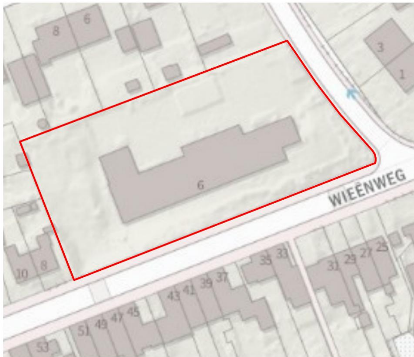
Figuur 1: Onderzoeklocatie Wieënweg 6, Brunssum

Hierbij ontvangt u van ons de rapportage inzake het uitgevoerde Quickscan Ecologische Waarden ter plekke van de ingreeplocatie Wieënweg 6, te Brunssum, zie figuur 1.