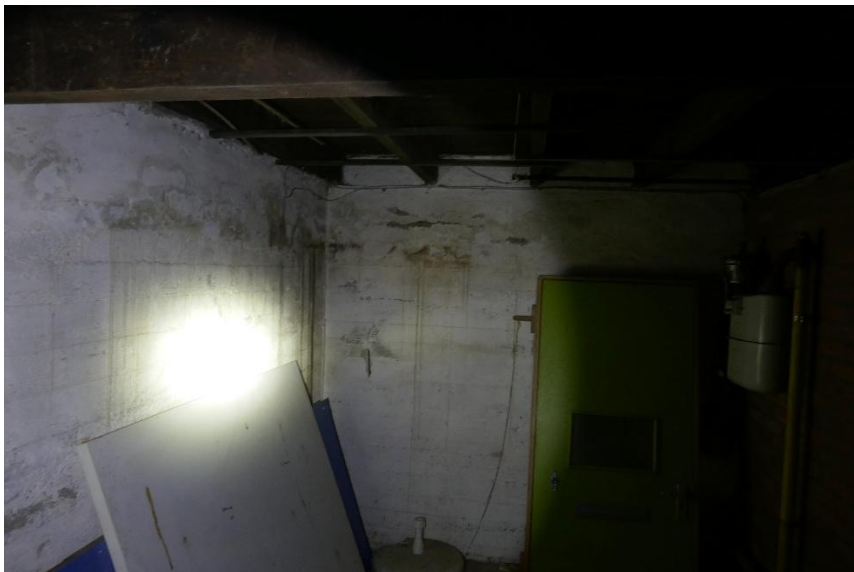
Foto 4: De kelder is qua klimaat geschikt voor vleermuizen, maar omdat deze niet toegankelijk is, is deze in de huidige situatie niet in gebruik als overwinteringsplaats