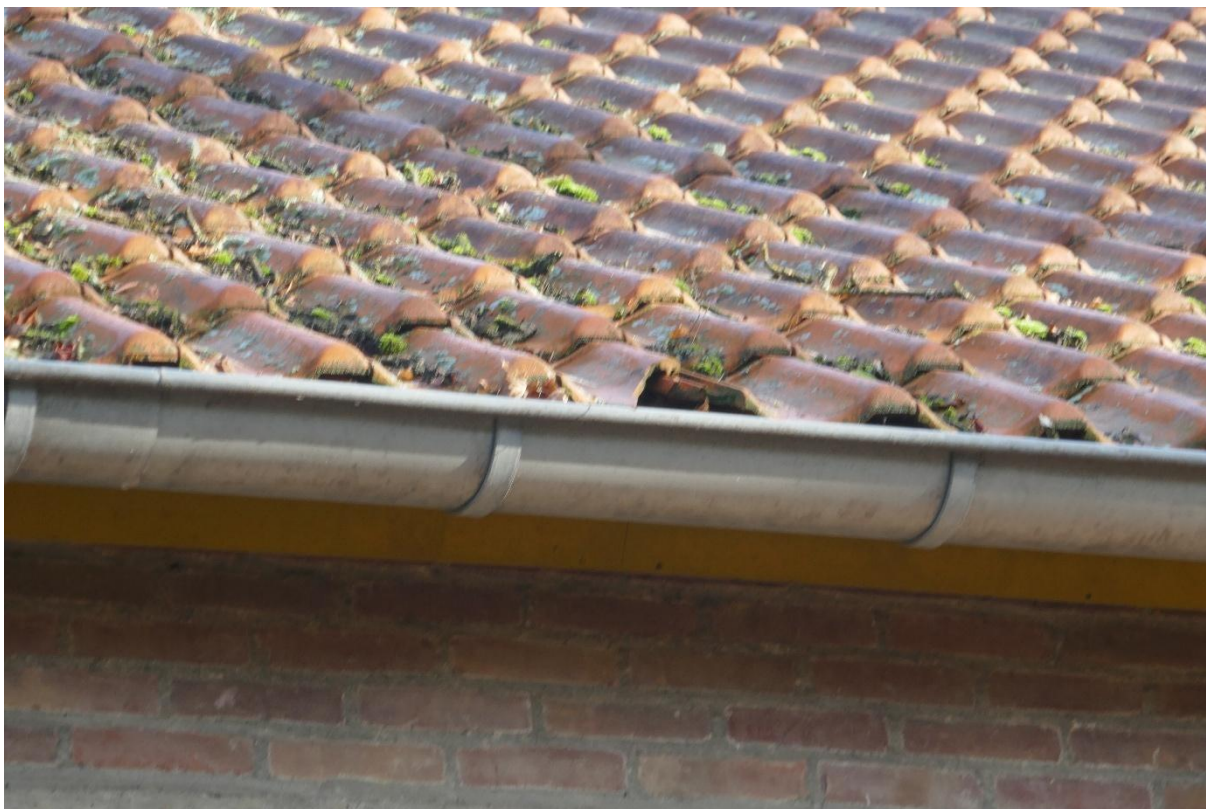
Foto 2: Er is één kapotte dakpan in het dak gevonden, maar vanwege de aanwezige vogelschroot onder de dakpannen is het niet mogelijk dat er vogels (zoals huismus) onder de pannen broeden.