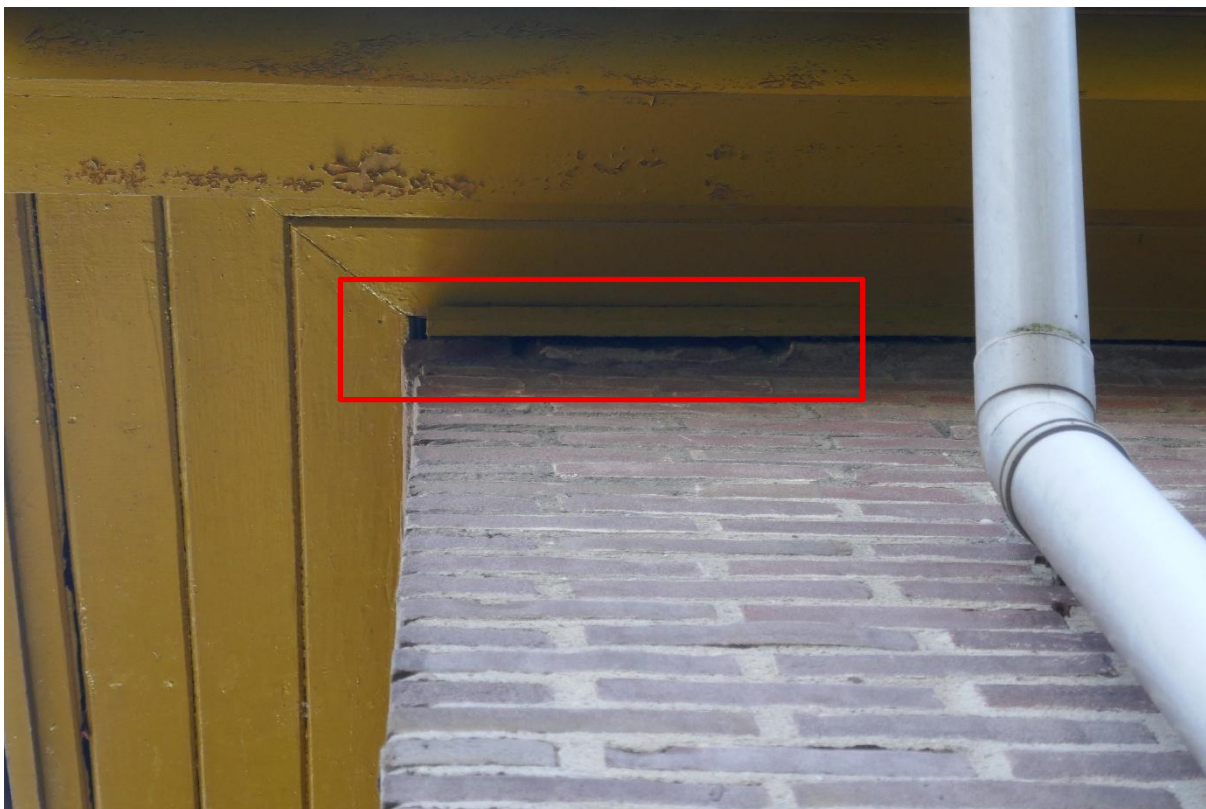
Foto 6: Ook aan de kopse kant zijn enkele geschikte invliegopeningen te vinden waar vleermuizen achter de bekisting van de regengoot kunnen kruipen

In het kader van de Omgevingswet kan geconcludeerd worden dat er mogelijk sprake is van de aanwezigheid van vaste rust- en verblijfplaatsen van vleermuizen bij de te renoveren bebouwing. Nader soortgericht onderzoek om dit met 100% zekerheid uit te kunnen sluiten is noodzakelijk.