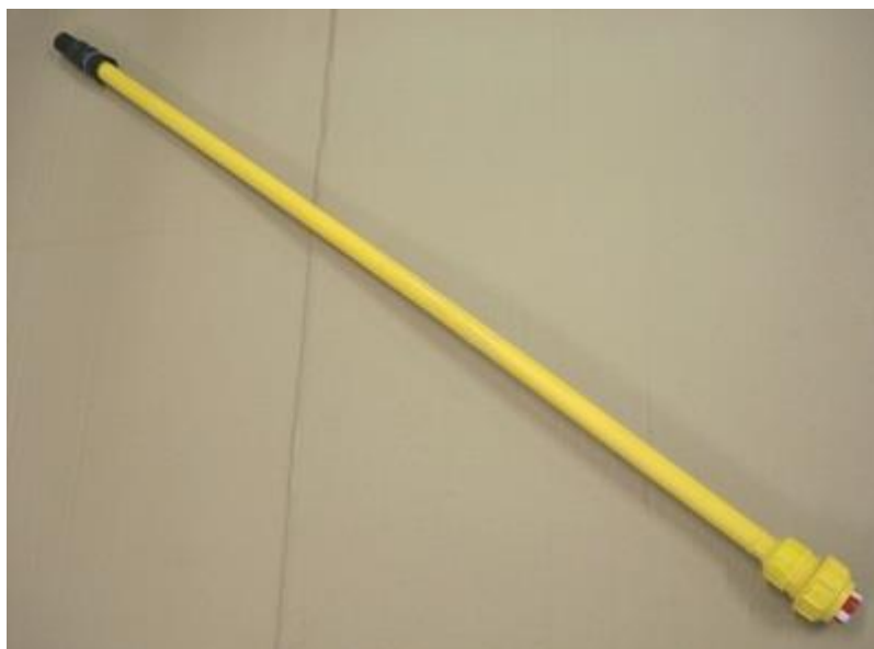
Figuur 2 Peko