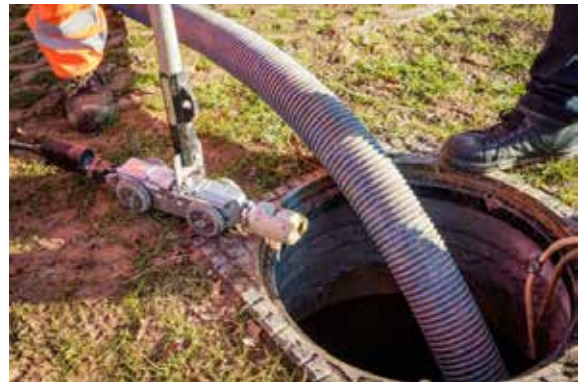
Figuur 3: Robotcamera