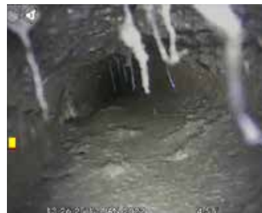
Figuur 8: Voorbeeld van sedimentlaag >2cm

C Ja, de sedimentlaag is >2cm > het kanaal moet worden gereinigd