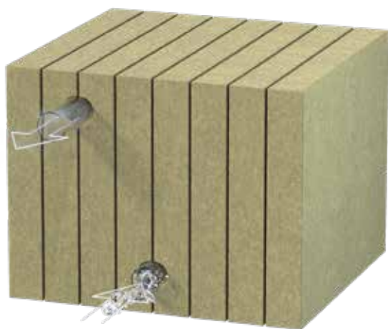
Figuur 1: werkingsprincipe van een Rockflow systeem: Waterinlaatkanalen aan de onderkant, luchtuitlaat aan de bovenkant.

Water stroomt het Rockflow systeem in via het waterkanaal aan de onderkant. Van daaruit verdeelt het water zich in de buffer van steenwol. Lucht verlaat het systeem door de luchtuitlaat bovenaan (Figuur 1). Het aantal kanalen is afhankelijk van de omvang van het systeem.