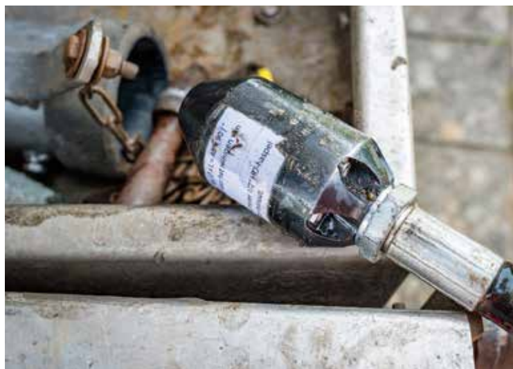
Figuur 12: 0-15° of terugspoeiende sproeikop