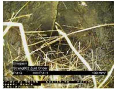
Figuur 10: Voorbeeld van wortels die het kanaal in groeien