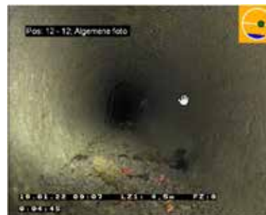
Figuur 7: Voorbeeld van een normale sedimentlaag <2cm

B Ja, maar de laag is dun > geen onmiddellijke actie nodig; plan een nieuwe inspectiedatum