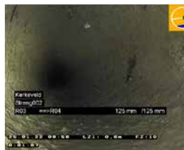
Figuur 9: Voorbeeld van een kanaal waarbij sediment het hele oppervlak van het kanaal bedekt

D De gehele omtrek van het kanaal is bedekt met sediment en de steenwolstructuur is niet meer zichtbaar > het kanaal moet worden gereinigd