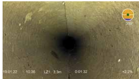
Figuur 6: Voorbeeld van een schoon kanaal

A Nee, het kanaal is schoon > geen actie nodig