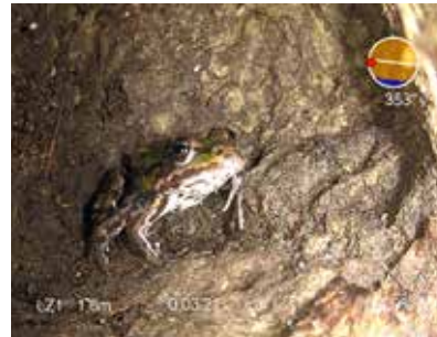
Figuur 11: Voorbeeld van een kikker in een kanaal