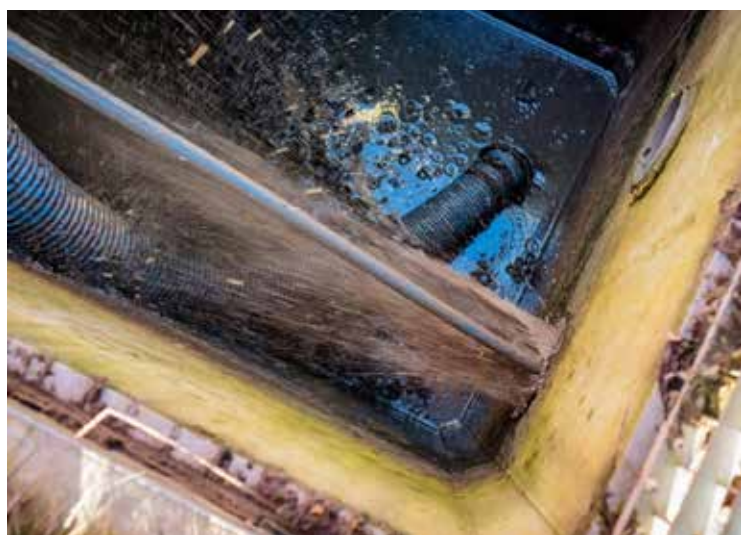
Figuur 13: Sediment dat uit het kanaal de put in wordt gestuwd